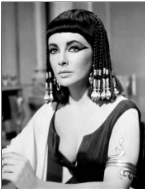
Элизабет Тейлор в роли Клеопатры.

24 октября 2000 года в берлинском Египетском музее обнаружен единственный в мире автограф Клеопатры.