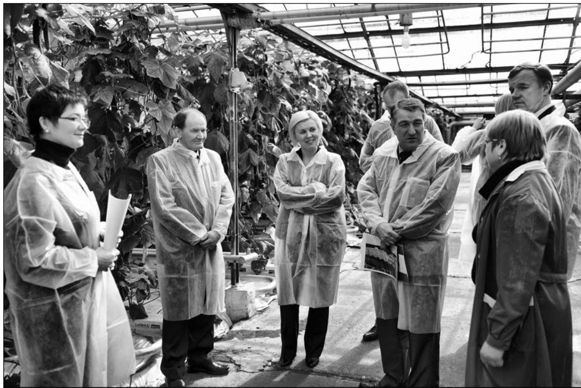
В минувший четверг Всеволожский район посетили руководители средств массовой информации Санкт-Петербурга и Ленинградской области. Материал читайте на 4-й странице.