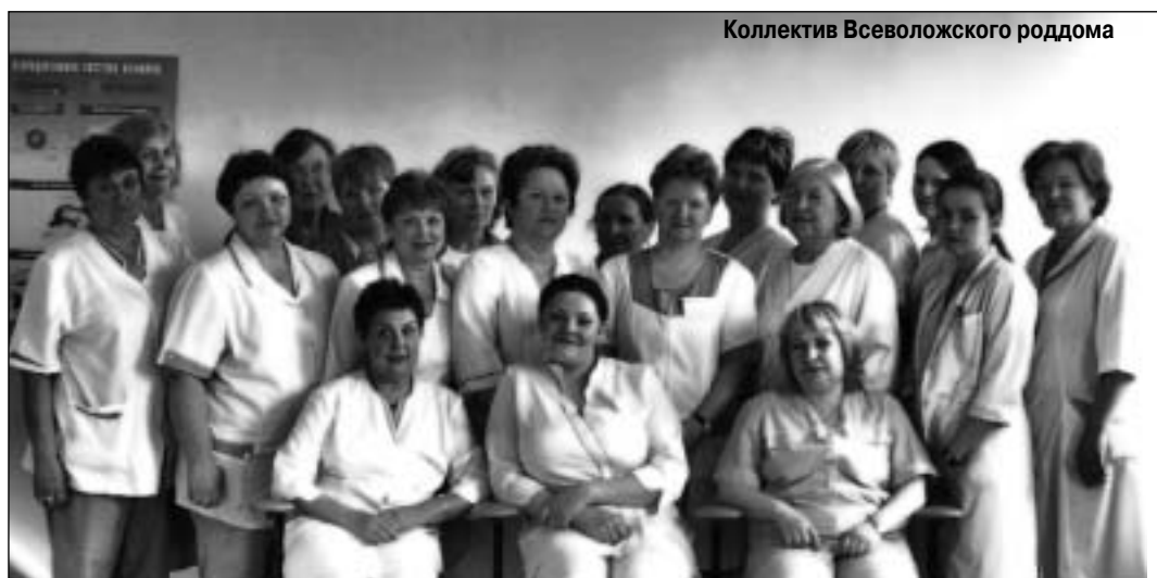
Коллектив Всеволожского роддома

В 1979 году на окраине Всеволожска, в тиши сосен, открылся родильный дом, значит, многие жители нашего района впервые увидели свет в стенах этого медицинского учреждения. С тех пор пролетело три десятилетия, и роддом оказался «домом у дороги» - и это неприятное соседство с шумящей трассой стало тем единственным «минусом», который называют всякий раз при сравнении отрезков времени, обозначаемых понятиями «тогда» и «сейчас».