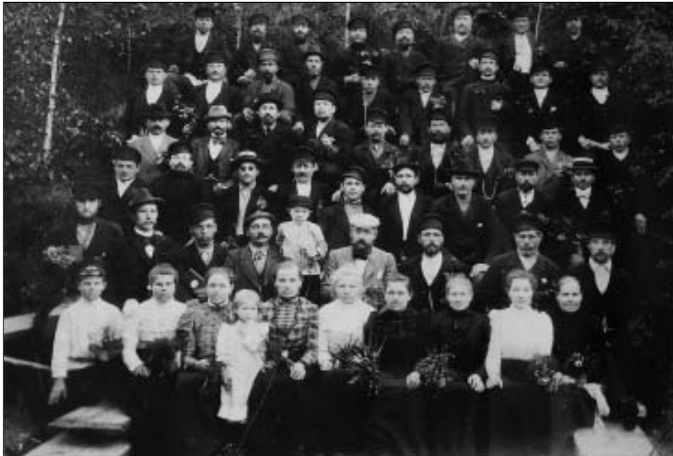
Рабочие Шлиссельбургского порохового завода. 1909 год.