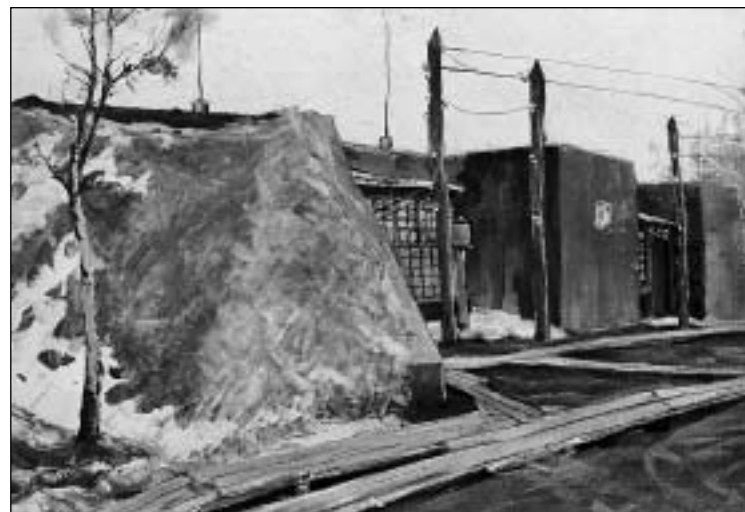
Окруженная валами пороходельная мастерская. 1909 год.