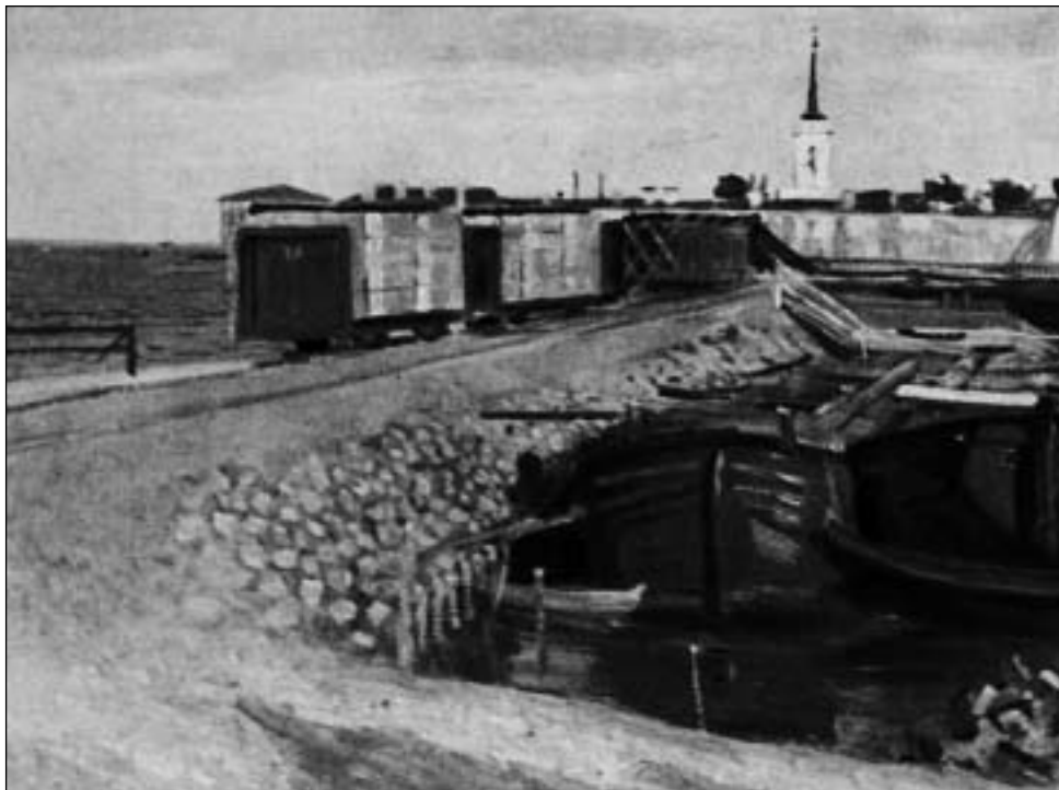
Пристань Шлиссельбургского порохового завода. 1909 год.

мени, благодаря чему выпускалась только высококачественная, конкурентоспособная продукция. На Всероссийской промышленной и художественной выставке 1896 года в Нижнем Новгороде Шлиссельбургский пороховой завод как бы подводил итог 12-летней деятельности, выставив для обозрения образцы всех видов своей продукции. «Русскому обществу для выделки и продажи пороха» была присуждена заслуженная награда – право изображения государственного герба на выпускаемой продукции. Отмечено было значение завода для обороны государства и заботливое отношение к рабочим.