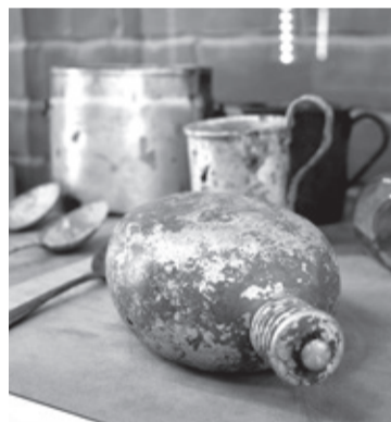
Экспонаты школьного музея в Лаголово

В музее часто проводятся мастер-классы, встречи с краеведами и ветеранами Великой Отечественной войны.