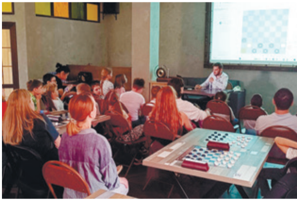
А 12 июня в помещении во Всеволожске в шашечно-шахматном клубе «Марс» состоялся детский шахматный турнир, посвященный Дню России.