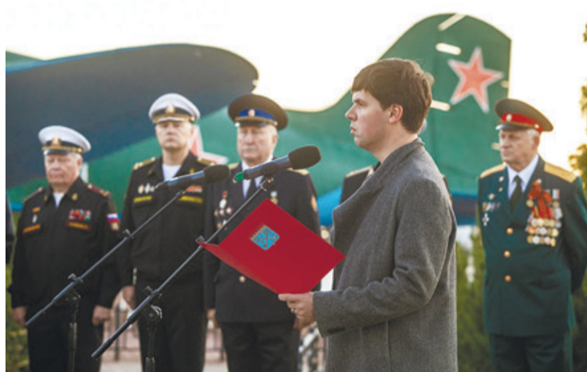
Собравшиеся возложили памятные венки к памятнику «Героям Ладоги» и опустили в волны Ладоги живые цветы.

Мы скорбим по всем, кто ценой своей жизни выполнил святой долг, защищая в те суровые годы наше Отечество. Особенно остро пережи-