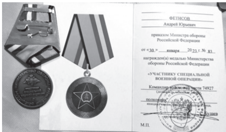
Среди наград ветерана — медаль «За отвагу» и медаль «Участнику СВО»

ЛЮДМИЛА КРИВОШЕЕВА