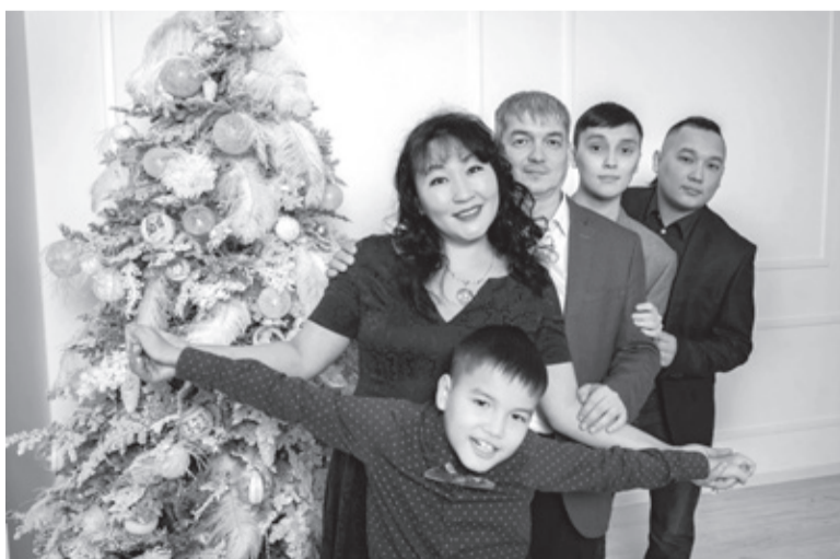
Хранители педагогических традиций — семья Юзвик из Мурино

АЛЕКСЕЙ АСТАПЧИК ФОТО ПРЕДОСТАВЛЕНЫ ГЕРОЯМИ МАТЕРИАЛА