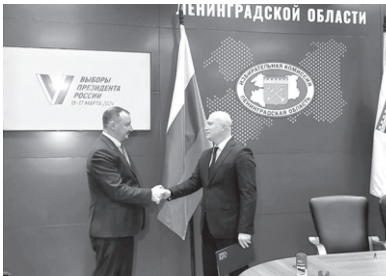
Леноблизбирком и «Почта России» заключили соглашение о сотрудничестве

Менее двух месяцев остаётся до трёхдневного голосования на президентских выборах 2024 года. Мы узнали у Избирательной комиссии Ленинградской области, как регион готовится к этому событию.