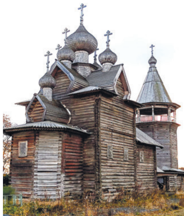
Церковь Дмитрия Солунского в деревне Щелейки. Постройка 1783 года