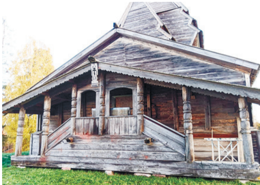
Фрагмент церкви Георгия Победоносца в деревне Родионово. Примерное время постройки – конец XV века

Когда-то вся Русь была застроена деревянными домами, усыпана узорчатыми теремами. Традиция деревянного строительства существовала во многих странах, но нигде это мастерство не достигло такой высоты, как в России. Особенно старались наши плотники при строительстве зданий духовного предназначения. Поэтому сейчас они имеют большую ценность, чем жилые деревянные постройки.