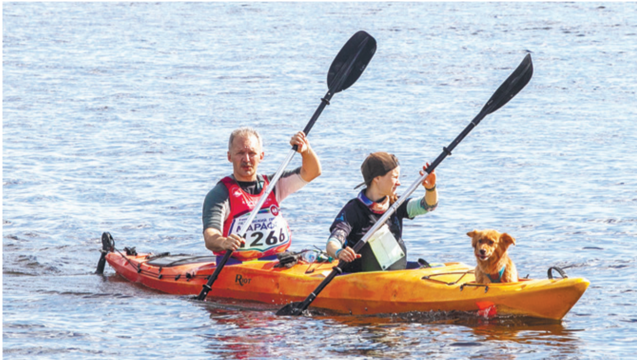
Трое в лодке, считая собаку