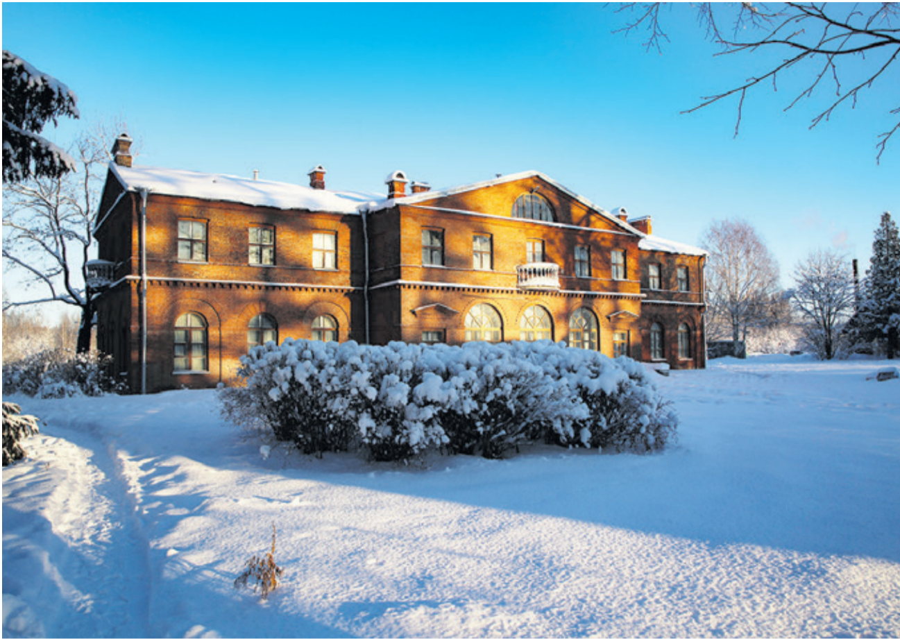
«Погляди хоть ты! Словно кто-то тороватый свежей, белой, пухлой ватой все убрал кусты»