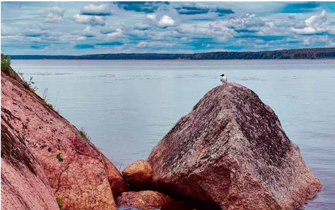
Под ним струя светлей лазури, над ним луч солнца золотой...