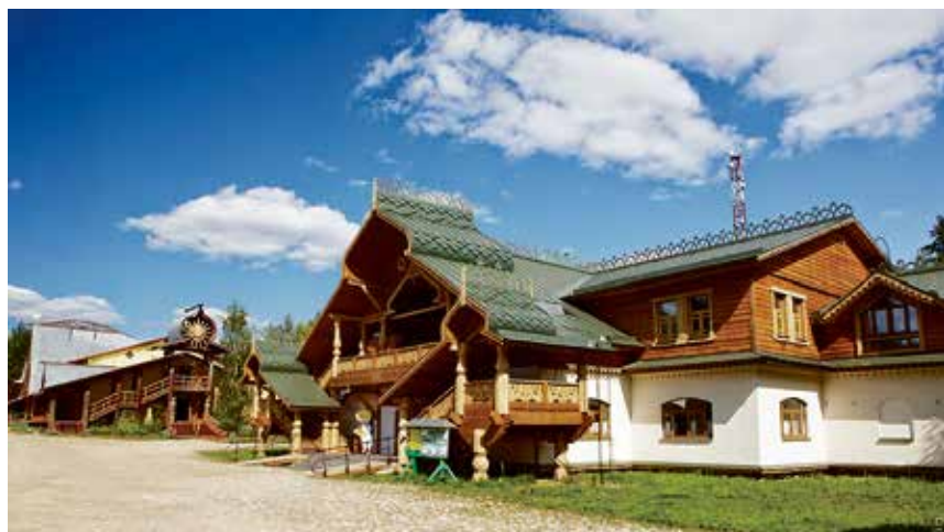
Интерес к внутреннему туризму в России сегодня значительно вырос, а одним из самых популярных направлений являются Ленинградская область и Карелия.

Утром следующего дня теплоход пришвартовался к причалу знаменитой туристической деревни Верхние Мандроги, живописно раскинувшейся на берегу Свири. В прошлом веке, до Великой Отечественной войны, её население составляли вепсы – хлебопашный, талантливый и радужный народ рыбаков, охотников и судостроителей. К сожалению, в годы войны состоявшая из 29 дворов деревня полностью была уничтожена, а её жители переселились в ближайшие поселения. Возрождение деревни как культурно-туристического центра, ориентированного на круизных туристов, началось в конце девяностых годов. В настоящее время в Верхних Мандрогах проживает около 40 человек, и все они являются сотрудниками туристического комплекса, в котором удалось совместить развлекательную часть стиля «русский лубок» с музеем деревянного зодчества и народных ремёсел.