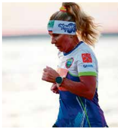
■ Ольга Савойская