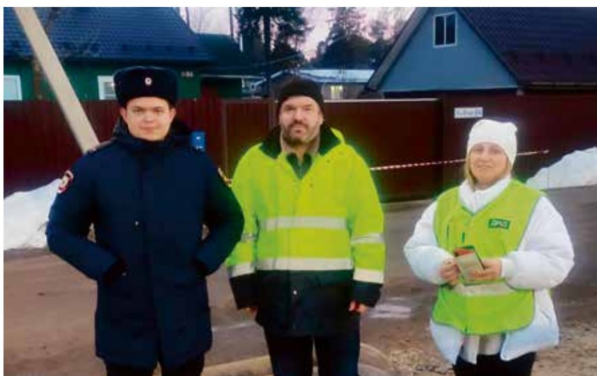
■ Сейчас в составе «Всеволожского дозора» 20 человек