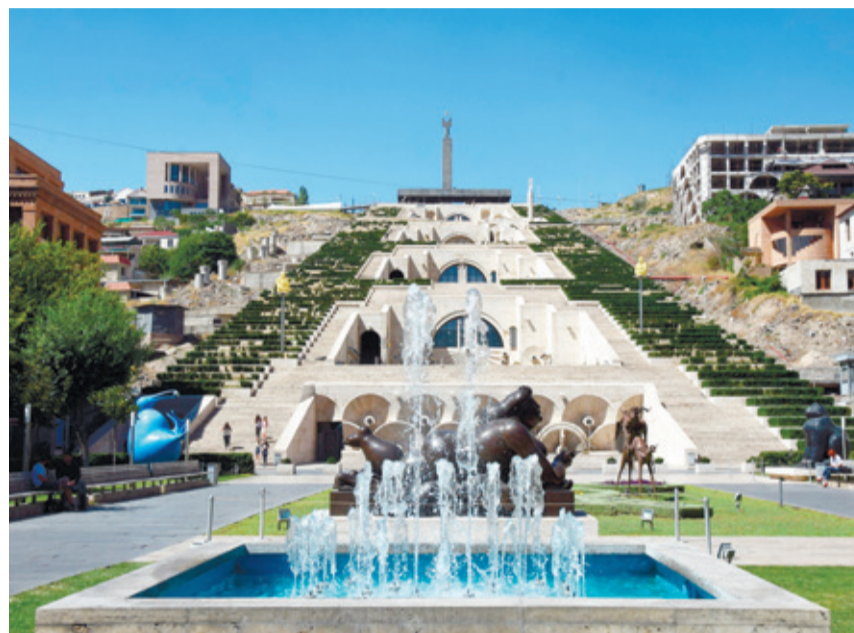
Архитектурно-монументальный комплекс в Ереване. Представляет собой каскад из пяти открытых террас. Связывает центральный район Кентрон с районом Канакер-Зейтун

Зато армяне любят рассказывать, что ещё в начале прошлого столетия на пляжах Севана отдыхали и черпали вдохновение Осип Манделштам, Максим Горький, Валерий Брюсов... И все были очарованы. Да, в Закавказье много озер. Но корона, бесспорно, принадлежит Севану. Озеро манит своим очарованием. Верующие говорят, что три паломничества на Севан равны одному паломничеству в Иерусалим. У берегов этого озера находится главный центр, где готовят священнослужителей. Кстати, по одной из версий, название Севан родилось из словосочетания «сев ванк» (черный монастырь).