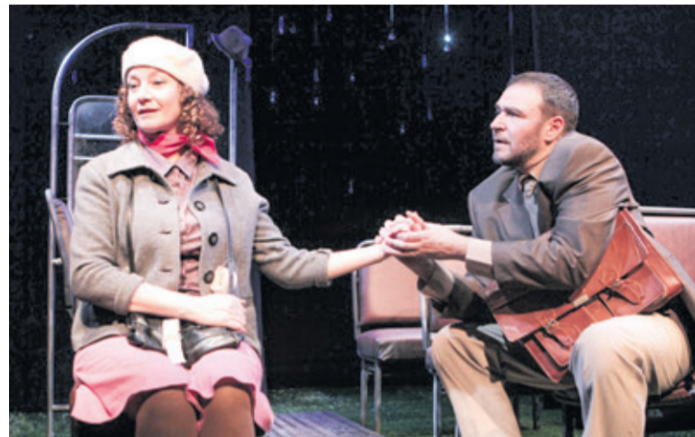
■ «Последний троллейбус». Драматический театр «На Васильевском»