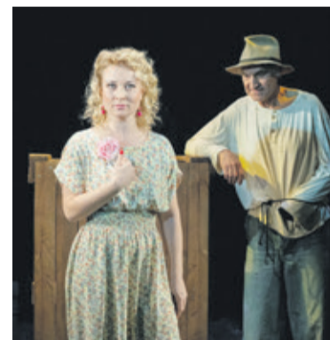
■ «О мышах и людях». Драматический театр «Комедианты»

счастье, его пределах и границах. И есть в этом спектакле что-то и от иронии судьбы, и про иронию судьбы, хотя героини наши не ходят накануне Нового года в баню и не запикивают в самолет по ошибке свою подругу, отправляя ее в другой город навстречу счастью. Но наши героини тоже ищут счастье для своей подруги, по дороге в гости к ней подобрав в подъезде пьяненького Деда Мороза, и везут в подарок незамужней подруге своего же соседа,