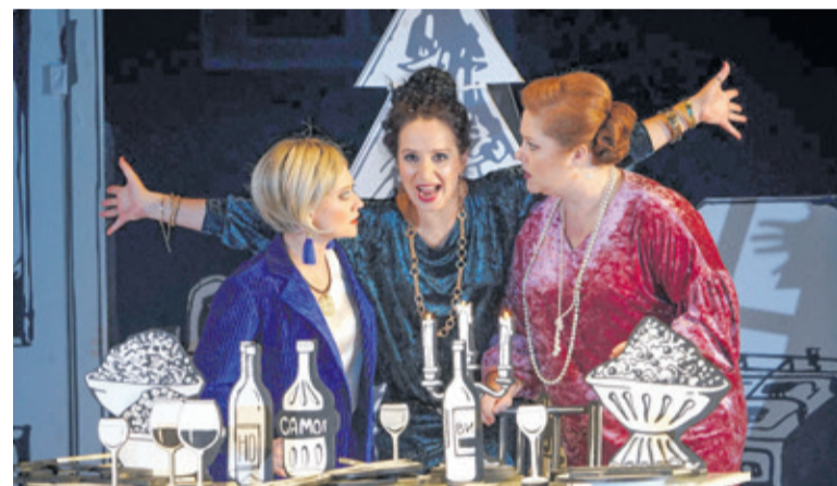
■ «С новым счастьем!». Драматический театр «На Литейном»

Вторая наша постановка – тоже премьера. На нашей сцене она прошла буквально в конце февраля. Спектакль «Пушкин. Дорожные истории» – дань нашему великому соотечественнику Александру Сергеевичу Пушкину, 225-летие которого мы ныне отмечаем. Две истории из рассказов Белкина – «Стационарный смотритель» и «Граф Нулин» объединены в этом спектакле, и мы решили, что имеет смысл показать его всеволожскому зрителю в юбилейный год великого поэта.