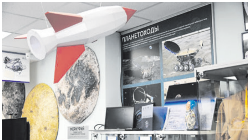
■ Экспозиция музея в Выборге