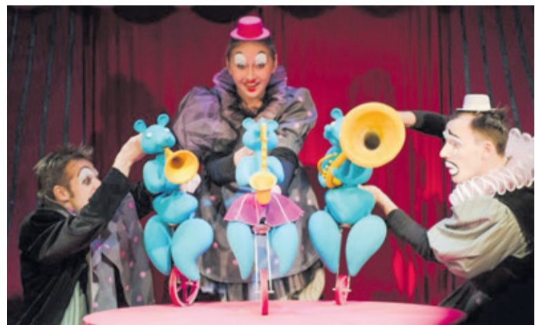
■ «Тараканище». Санкт-Петербургский государственный театр кукол «Бродячая собачка»

■ АВТОР Татьяна ТРУБАЧЕВА