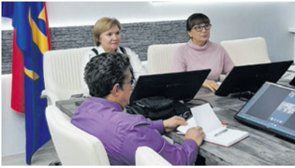
ГРАФИК ПРИЁМА ОБЩЕСТВЕННОЙ ПАЛАТЫ ВСЕВОЛОЖСКОГО РАЙОНА В ЯНВАРЕ

Уважаемые жители Всеволожского района, каждую среду с 16.00 до 18.00 Общественная палата проводит приём граждан по адресу: г. Всеволожск, Колтушское шоссе, д. 138, каб. 125.