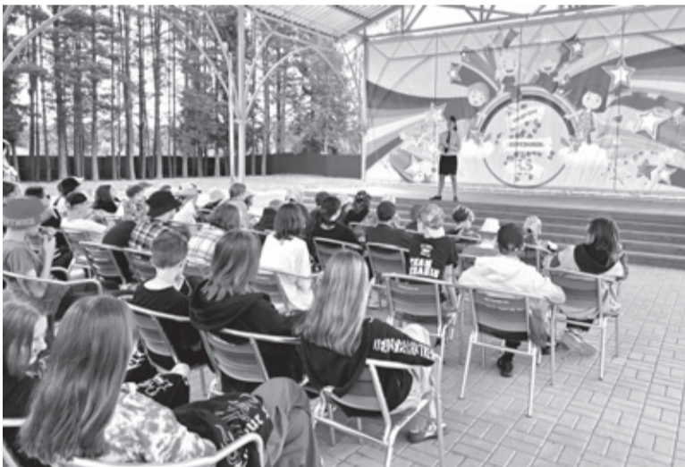
Госавтоинспекция активно работает с детьми во время летних каникул

БЕСЕДОВАЛ АЛЕКСЕЙ АСТАПЧИК