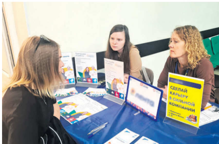
Сегодня большим спросом на рынке труда пользуются квалифицированные рабочие: слесари, электромонтеры, монтажники, а также швеи, инженеры и секретари

В разговоре с корреспондентом «Всеволожских вестей» работодатели отмечали, что на местных предприятиях дефицит именно в качественных кадрах: требуются профессиональные