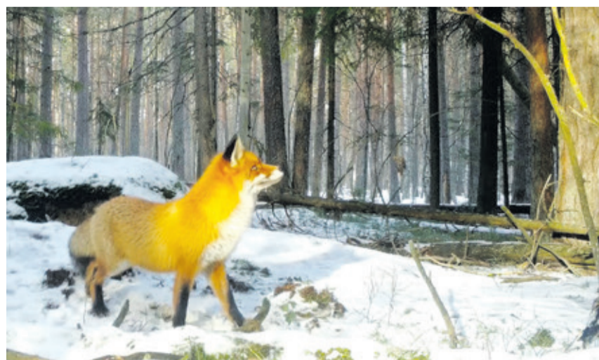
Лучший отчим животного мира, который становится лучшим отцом для сироток-лисят, – это лисовин. Именно так называется самец обыкновенного лисьего племени.

– Потрясающе! У самца ярко выраженная черно-белая маска на голове. Такое зорро! Ремез занесен в Красную книгу и в Санкт-Петербурге, и в Ленинградской области, но встретить эту удивительную птичку и поразиться ее стройному таланту можно. Она вьёт гнездо в виде варежки. Большим пальцем вниз, этот «палец» и есть вход в гнездо. Гнездо вьёт самец. Приглашает будущую подружку, всячески ее обхаживает, напевает ей любовные песенки, и если складывается пара и появляется потомство, – а самочка молодая и неопытная, – то