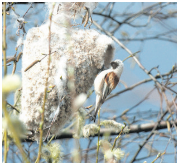
Ремез занесен в Красную книгу и в Санкт-Петербурге, и в Ленинградской области, но встретить эту удивительную птичку и поразиться ее строительному таланту можно. Она выёт гнездо в виде варежки.

в этом семействе случается такой казус: она откладывает яйца и улетает, покидая навсегда и детей, и мужа. А самец остается и один выращивает птенцов. Вот такой преданный отец и всепрощающий муж. Подобным поведением отличается ещё одна птичка, которая называется забавно: пятнистая трехперстка. Вот такое сложное название у этой птицы, которая живет в Индии, Китае и у нас на юге Приморского края. Там тоже дамочки устроены таким образом, что она сама строит гнездо, всячески привлекает и обихаживает будущего мужа, зазывает его в свою квартиру. Она, кстати, величницей с перепелку, а самец раза в два меньше.