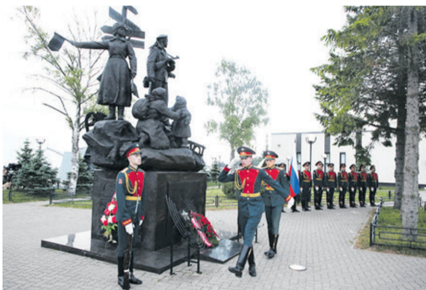
Память о великом подвиге советского народа-победителя сегодняшнему поколению необходимо не только сохранить, но и передать следующим поколениям.

Советский Союз потеряет больше 27 миллионов своих сограждан.