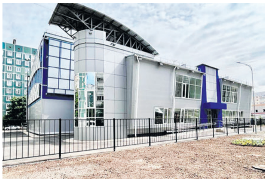
Одновременно в ФОКе смогут заниматься до 90 человек.

Одновременно в ФОКе смогут заниматься до 90 человек. Этим летом им станут доступны универсальный игровой зал 36x18 метров и тренажёрный зал для разминки. Здесь же раздевалки и душевые, оборудованные в том числе для маломобильных групп населения. Общий объем финансирования на строительство спорткомплекса, включая средства