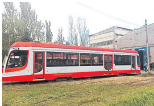
Особое внимание – восстановлению трамвайно-троллейбусного парка.

Продолжится и масштабная кампания по дорожному ремонту. В частности, в 2023 году планируется восстановить 7 крупных дорог общей протяженностью около 10 километров. Займутся специалисты Ленобласти, в том числе и восстановлением сопутствующей инфраструктуры – в списке работ значится установка 29 ярко-оранжевых остановок общественного транспорта, замена дорожных знаков, а также ремонт наружного освещения.