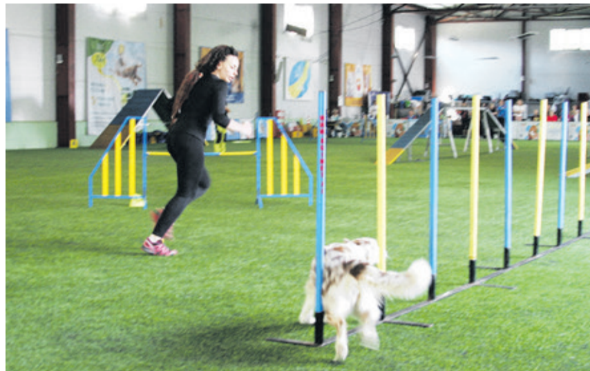
Для победы в этом турнире должно быть пройдено четыре трассы. Это сложно не только для животного, но и для человека.

— В Санкт-Петербург я приезжаю несколько раз в год. Здесь очень комфортно. На полу спортивного комплекса прекрасное синтетическое покрытие. На нём собаки показывают хорошую работу. Это очень важно для нашего вида спорта. На дистанции мы придумали для собак несколько специальных ловушек. В этом есть определенный смысл: прогнать животное на скорость по определенному маршруту и не попасться в неё. Неприятно же, когда на соревнованиях всё просто и очевидно. Поэтому на трассе должны быть свои изюминки. Аджилити — это смешение нескольких видов спорта. Во-первых, футбол, у нас рваный бег, мгновенная смена темпа, торможение и рывки. Сложные забеги с приличными нагрузками. Во-вторых, определенного рода шахматы. Необходимо на дистанции всё так выстроить и просчитать, где собака после преодоления барьера окажется, куда её вынесет, где надо в этот момент находиться ее владельцу. И, несомненно, лёгкая атлетика, где свои физические кондиции на дистанции должны показывать не только четвероногие питомцы, но и их хозяева. Ошибка на трассе — это 95% вина человека. Не туда поехал, не туда вывел. Сначала многие говорят, что всё правильно сделано. Но потом, просматривая видеозапись повторного забега, понимает, где допустил ошибку. На трассе у проводника работает всё — плечи, руки, ноги, а главное, голова. Именно между владельцем и его питомцем должно быть ментальное понимание друг друга. Поэтому этот спорт очень интересный