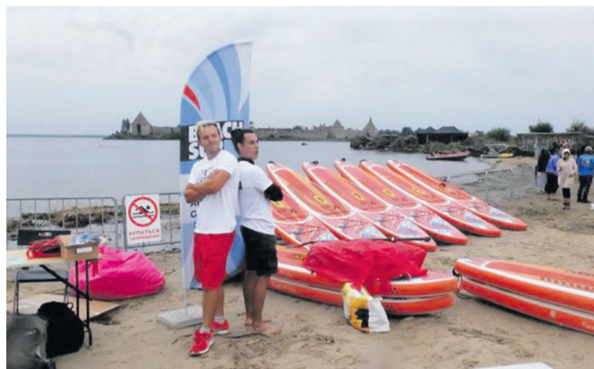
■ Фестиваль «Всеволожский шторм»

о работе за вторую половину 2023 года и озвучил планы на 2024 год.