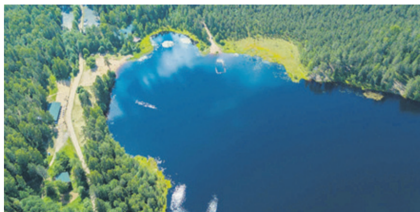
■ Пасторское озеро