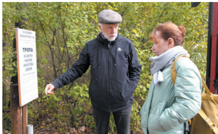
Областное правительство обустроило тропу к памяtnому месту