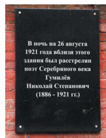
Мемориальная доска на здании накопителя