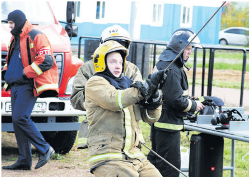
На полигоне 147-й пожарной части за звание сильнейших боролись представители 12 отрядов из Ленинградской области

...В гараже пожарной части специально выстроены деревянные конструкции, имитирующие узкие лазы с препятствиями. Всем участникам предстояло всего за полчаса найти потерявшего сознание коллегу среди завалов, в полной темноте. «Почему именно такое время? Баллона со сжатым воздухом хватает на 25 минут, ещё пять – это неприкосновенный запас», – просветили меня организаторы ме-