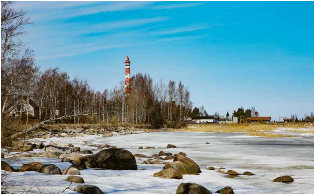
«Мороз-воевода дозором обходит владенья свои...»