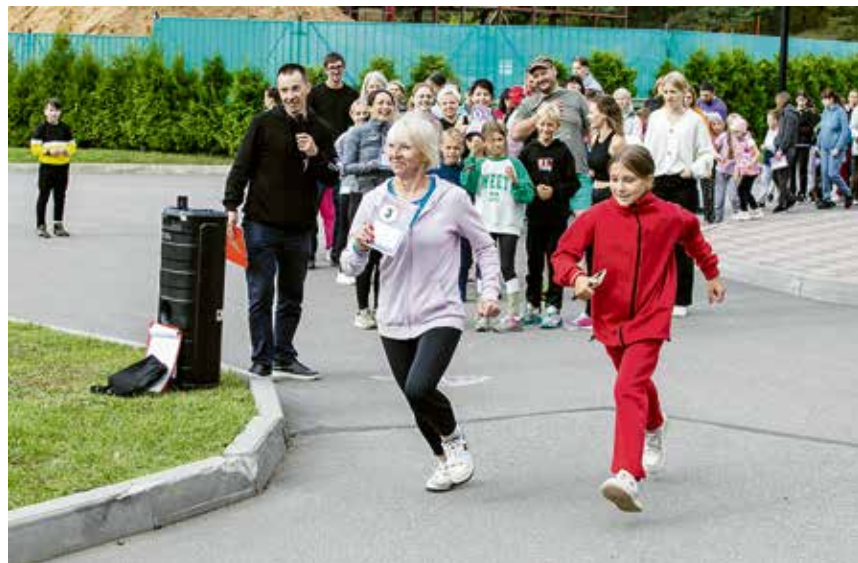
Участникам предстояло преодолеть относительно небольшую дистанцию. 1000 метров команды должны были пройти вместе и без потерь.

За соблюдением правопорядка зорко следили представители ДНД