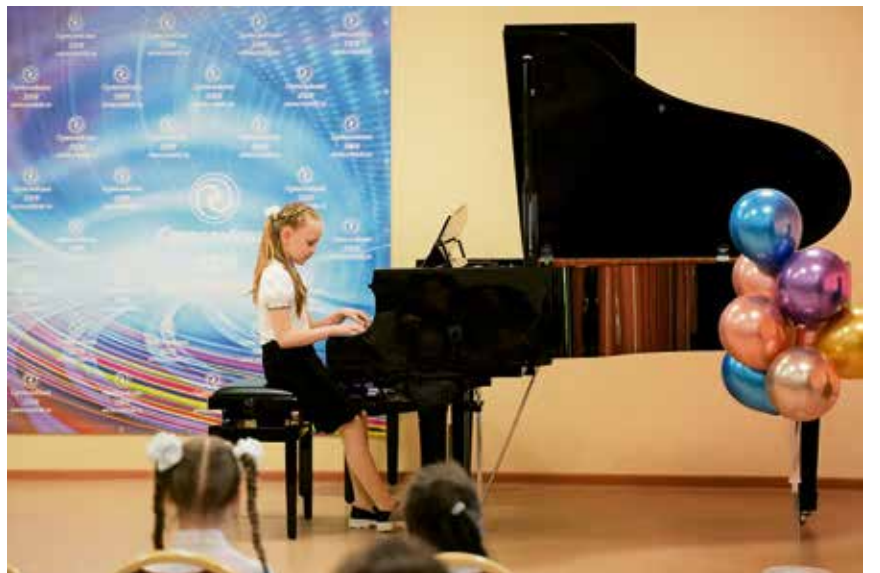
Обучение проходит по трём направлениям – в области изобразительного, музыкального и хореографического искусства.

Что касается наших ежегодных выпусков, то единого стандарта здесь у нас нет. В какой-то год это может быть 50 выпускников, в другой год – 30 и меньше. Приёмы были разные. В первый год работы школы учащихся было мало. Первоначально в её стенах учились 150–200 детей, а выпускались 10–15 человек. Сегодня, конечно, эта цифра выше. За эти годы получили свидетельство об образовании 913 способных подростков.