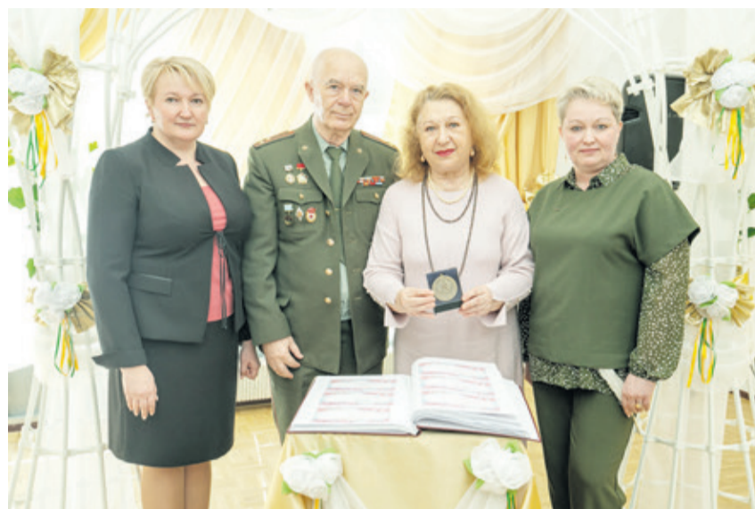
Семья не просто ячейка общества, но и главная ценность. Супруги смогли пронести сквозь годы любовь и верность, преодолели вместе все тяготы. Это заслуживает уважения!

Это необыкновенный день. Мы рады и гордимся такими «золотыми» и «бриллиантовыми» людьми. Наверное, в этот день вы вспоминаете,