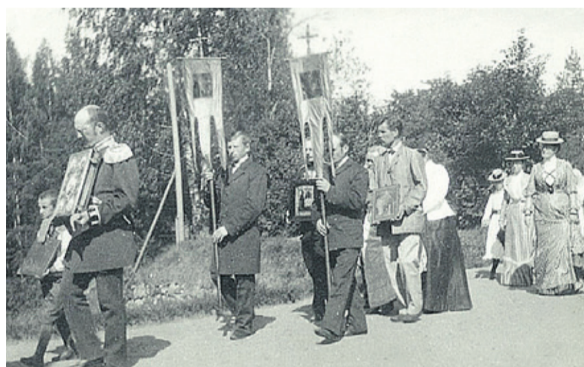
■ Крестный ход, начало XX века

В России в XVIII – XX веках православные, весьма часто посещая храмы, тем не менее причащались