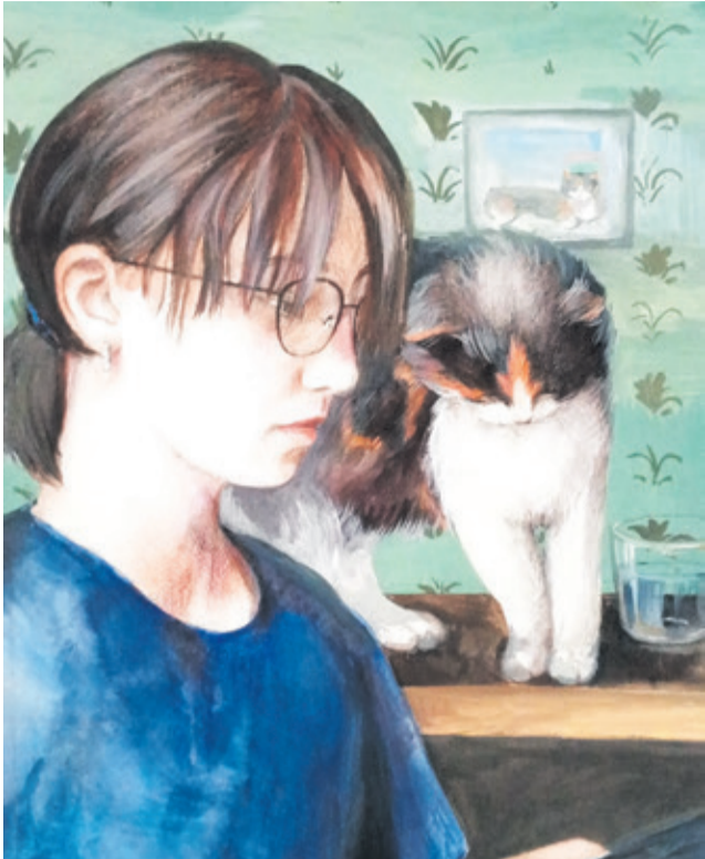
Художница и её муза