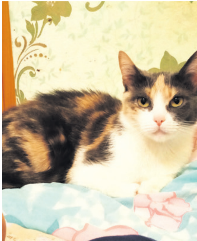
■ ФОТО Натальи Герасим. Рисунок Ксении Герасим

Приглашаем наших читателей принять участие в выпуске постоянной рубрики «Фотоэтюды». Присылайте фотографии на почту vsevesti@inbox.ru . В письме не забывайте указать свои фамилию и имя.