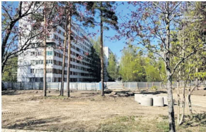
■ Началось благоустройство Нижнего парка во Всеволожске

«Голоса за свой проект на портале 47.gorodsreda.ru отдали больше 87 тысяч человек. Каждый из них точно знает, что уже повлиял на развитие родного края. При этом мы видим: жители ряда городов не знают, что могут выбирать из нескольких проектов благоустройства. Когда появятся новые общественные пространства, люди удивятся тому, что благоустройство могло быть совсем другим. Рекомендовал местным администрациям активнее задействовать волонтеров и управляющие компании, организовать прямые эфиры с проектировщиками в социальных сетях и разместить QR-коды со ссылкой на голосование в точках общественного притяжения. Каждый должен знать, что у него есть выбор», – рассказал заместитель председателя правительства Ленин-