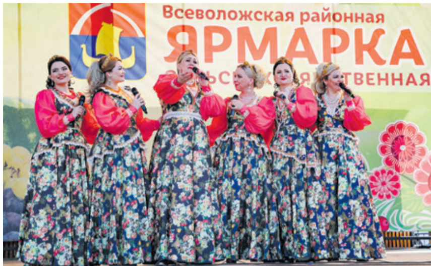
■ Ансамбль «Сороки»