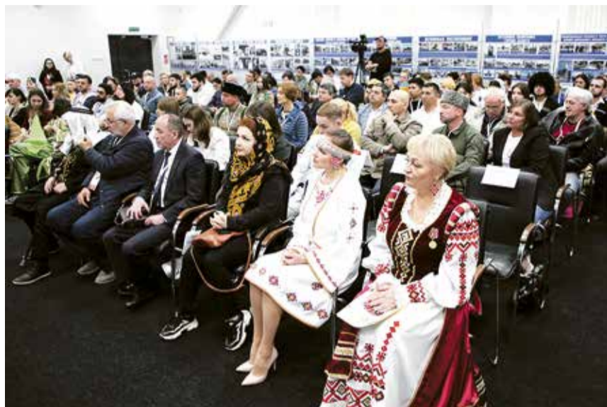
Открытие фестиваля состоялось в Музее «Дорога жизни» (филиал Центрального военно-морского музея).

Вступивший на фестиваль председатель Общественной палаты Ле-