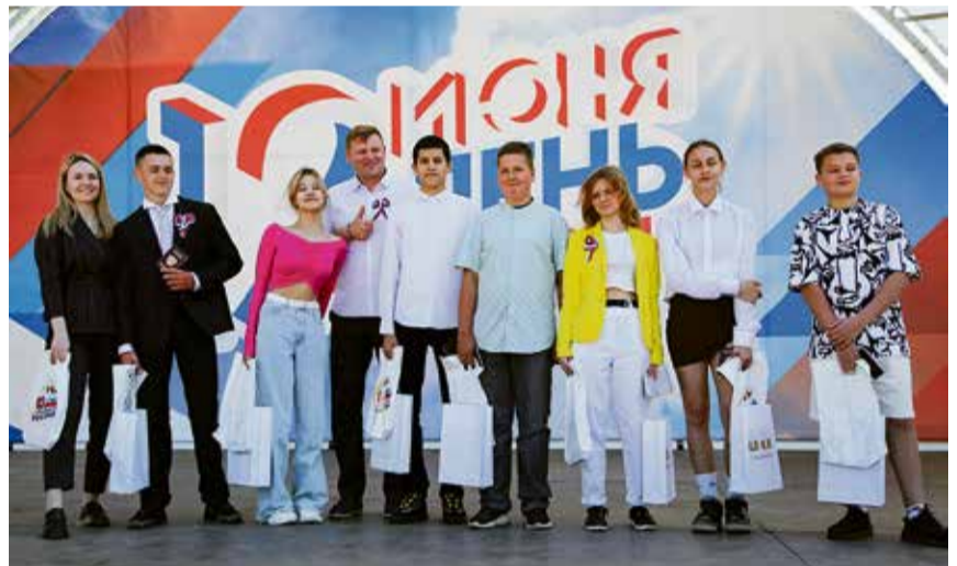
По традиции глава администрации района вручил семерым молодым жителям Всеволожского района главный документ гражданина страны – российский паспорт.

На праздничной «Песчанке» обратил на себя внимание всеволожский книжный фестиваль – 2023, органи-