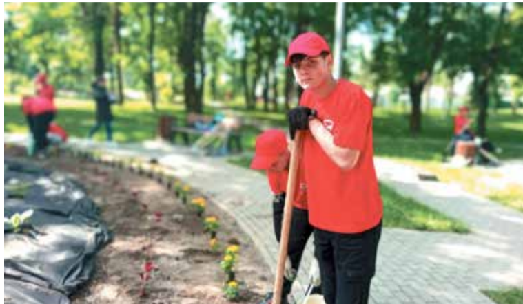
Старшеклассников привлекают к озеленению и уборке общественных территорий

Всего в Романовке трудятся две молодёжные бригады. В ка-