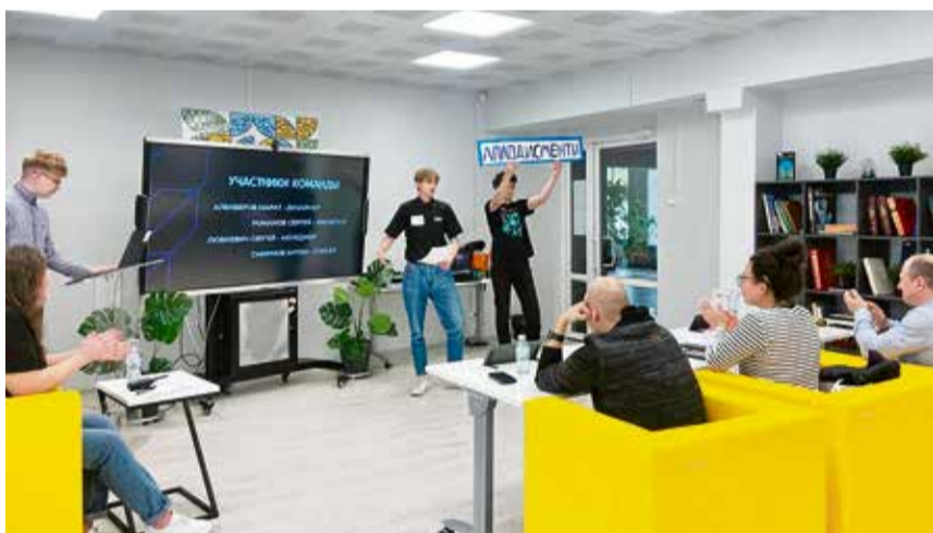
Фестиваль технических проектов собрал ребят из самых отдаленных районов Ленинградской области

Что необходимо для того, чтобы вернуть интерес к астрономии, или зачем «кванторианцам» новый дизайн одежды? Эти и другие интересные идеи представили участники фестиваля технического творчества и проектной деятельности для школьников Ленинградской области.