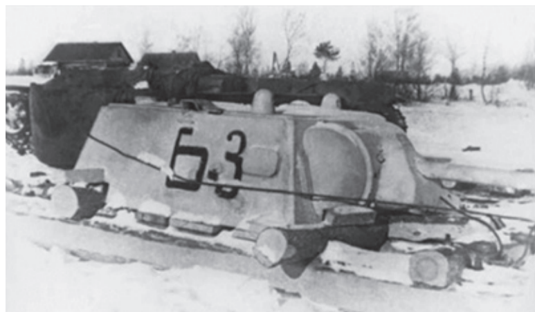
Сани со снятой башней танка КВ-1 перед переправой через Ладожское озеро. 124-я танковая бригада, февраль 1942 г.