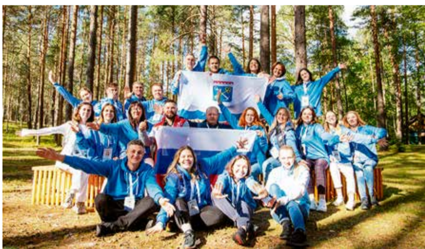
Мероприятие объединит 750 молодых людей из всех регионов России

Участники форума не только пройдут обучение по одному из семи