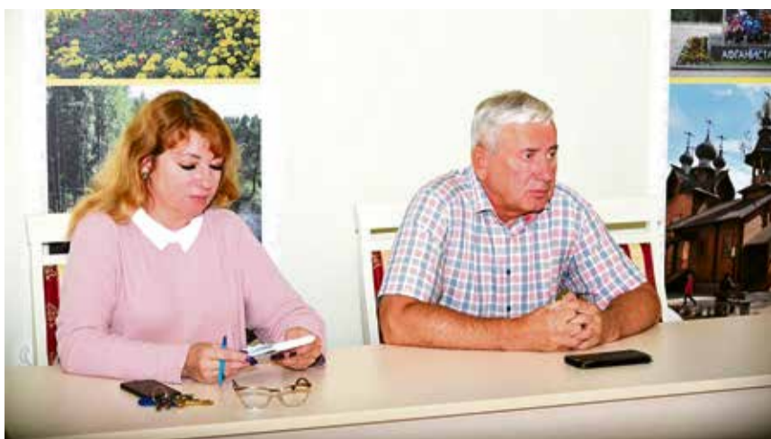
Глава Сертолово обсудил планы совместной работы с общественными организациями

Участники совещания уточнили юбилейные даты в общественных организациях, которые выпадают на бу-