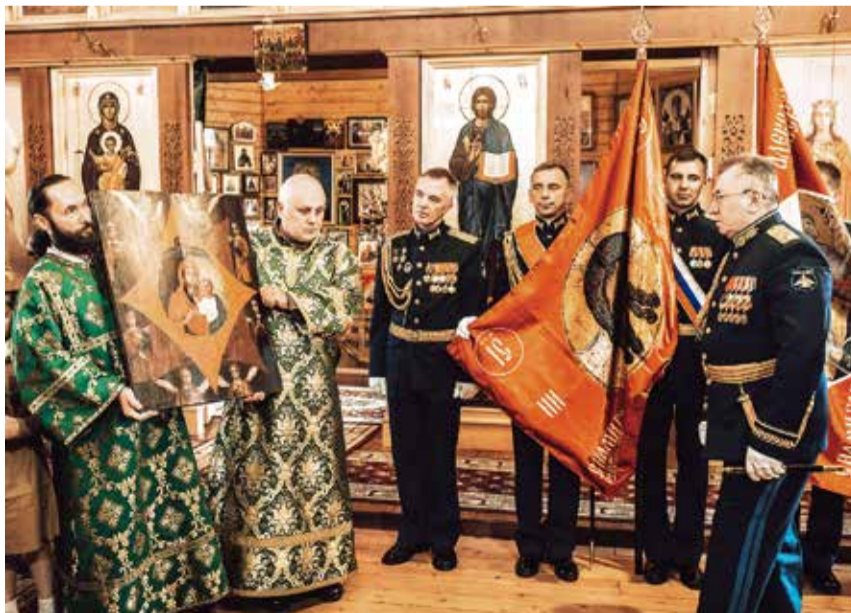
По окончании Божественной литургии были переданы военные стяги для 6-й армии ВВС и ПВО, а также восстановленная икона Божией Матери «Неопалимая Купина»

■ АВТОР В. ШЕМШУЧЕНКО