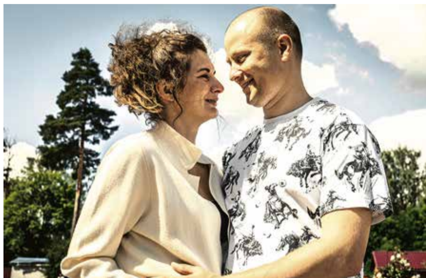
Житие православных супругов Петра и Февронии – образец христианского брака и символ идеальных семейных отношений

В их честь в храме Святой великомученицы Варвары в посёлке Рахья состоялся концерт. По окончании Божественной литургии заместителем председателя Комитета по местному самоуправлению, межнациональным