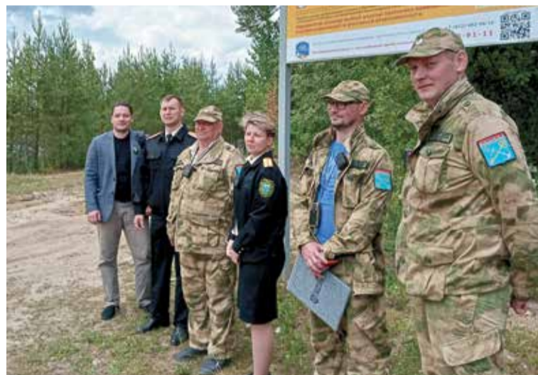
Госэконадзор регулярно проводит рейды на территории особо охраняемых природных зон

Услышав о полиции, компания присмирела. Одна из девушек подошла, извинилась и пообещала в скором времени удалиться восвояси. Всё-таки никому не нужны серьёзные проблемы с законом.