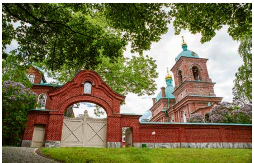
Замечательные экскурсии в мир этого удивительного острова рассчитаны на три дня

На острове много торговых мест, где можно приобрести сувенирную продукцию и не только её. Изготавливаемые монахами и трудниками сыры, копченая рыба, монастырский хлеб, молоко и молочные продукты, которые продаются в лавках, – исключительно