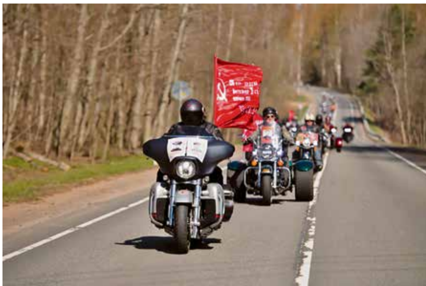
В памятном заезде участвовали более 30 участников мотоклуба «Дом», членом которого является и Александр Дрозденко.