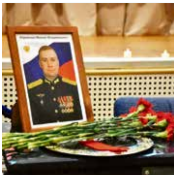
«Парта Героя» в Агалатовской школе