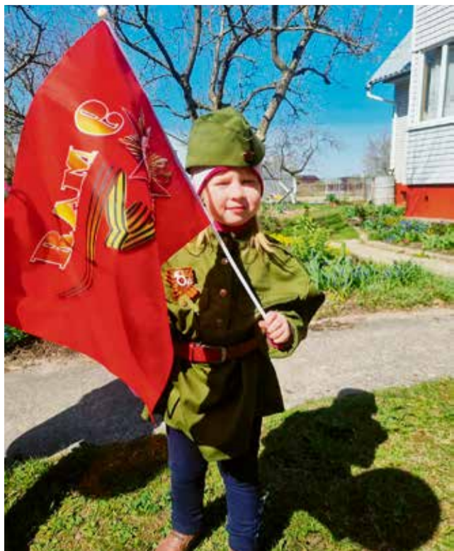
В этот праздник мы чествуем дедов, Защитивших родную страну, Подарившим народам Победу И вернувшим нам мир и весну! (Стихи Н. Томилиной)