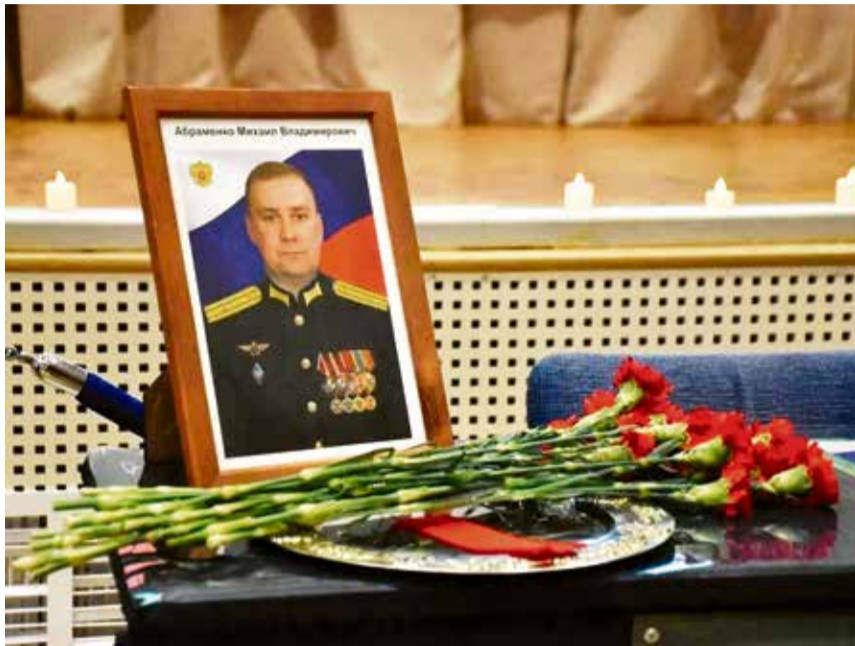
«Парта Героя» – это ученический стол, на котором размещена фотография Героя России Михаила Абраменко, информация о его биографии и заслугах.

Участники мероприятия украсили парту цветами и почтили минутой