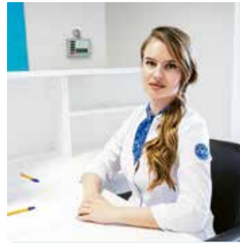
Кудровская поликлиника открыта для пациентов