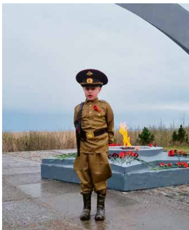
Приглашаем наших читателей принять участие в выпуске постоянной рубрики «Фотоэюд»*.

Присылайте фотографии на почту vsevesti@inbox.ru . В письме не забывайте указать свои фамилию и имя.