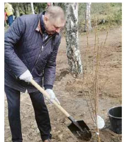
Депутат Государственной Думы РФ С.В. Яхнюк