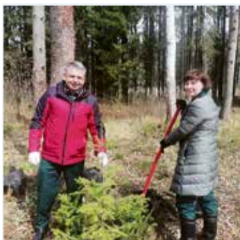
Цветущий сад нашей памяти