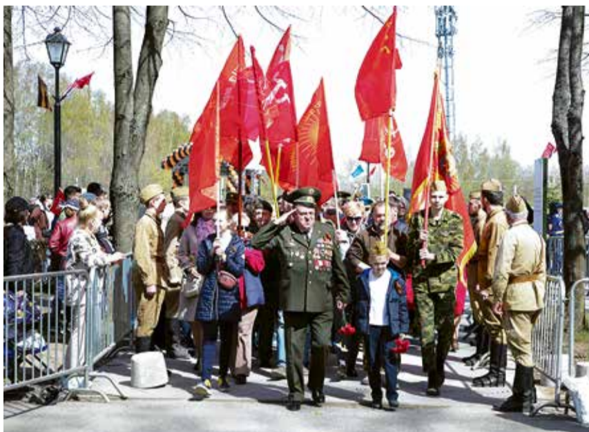
■ После минуты молчания состоялась церемония возложения венков.

И казалось, что каждый, пришедший в этот день к Румболовскому мемориалу, оглянулся на тех, кого сейчас уже нет с нами, на тех, кто и сейчас