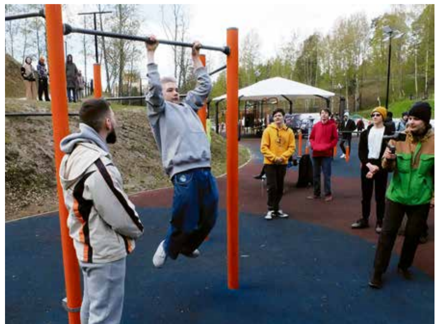
Соревнования проходили в трех дисциплинах среди участников трех возрастных групп

– Наша общественная организация образовалась всего год назад, но уже имеет клубы и секции во многих районах 47-го региона. Сегодня мы выбрали Всеволожск не случайно, поскольку хотим привлечь внимание местной молодежи к воздушно-силовой атлетике. В дальнейшем же планируем открыть здесь спортивный клуб или секцию, где молодежь под руководством опытных наставников будет заниматься силовой подготовкой. Сейчас, конечно, государством много делается для развития физкультуры и спорта, и все больше детей идут в спортшколы. Но все же основная масса подростков «виснет» в гаджетах, что здоровья никак не прибавляет. Вот мы и хотим исправить ситуацию, вовлекая школьников и студентов в деятельность, не требующую такой