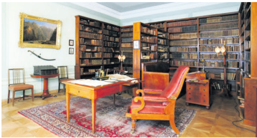
Музей-квартира А.С. Пушкина на Мойке