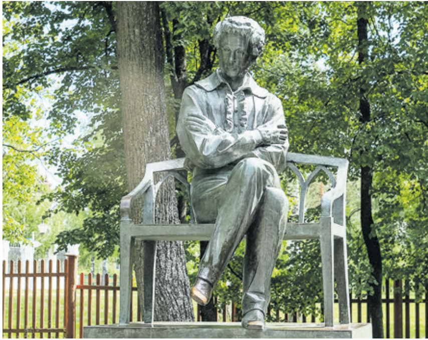
В 1979 году у здания музея в Болдино открыли памятник знаменитому русскому поэту

10 февраля перед посетителями музея предстаёт не полная квартира в одиннадцать комнат, которую снимал поэт, а лишь четыре: буфетная, столовая, кабинет и передняя. Только в этот день в них сняты все верёвочные