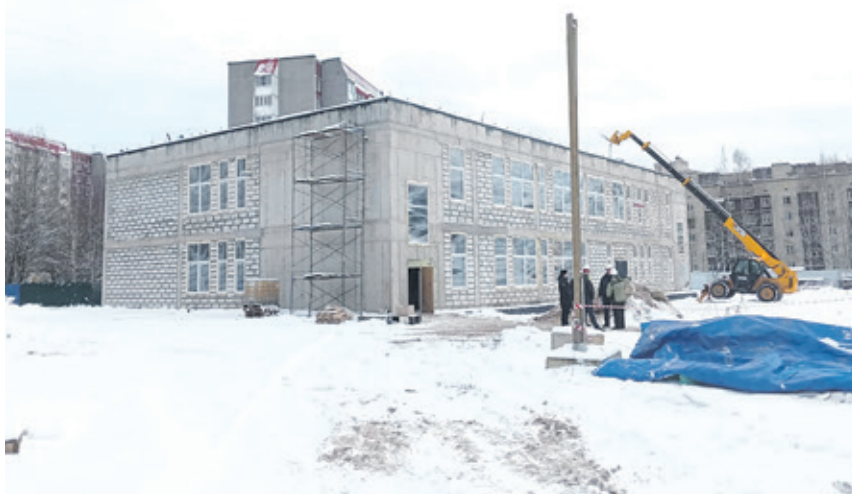
В сентябре планируется ввести двухэтажную пристройку к основному зданию средней школы № 4 в городе Всеволожске

Строительство бассейна началось в 2017 году. Официальное открытие состоялось летом 2022 года. Общий объём бассейна составляет 2,5 тысячи м³, глубина – 30 метров.