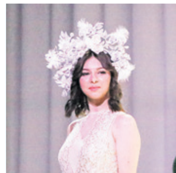
Конкурс красоты в Бугровском поселении