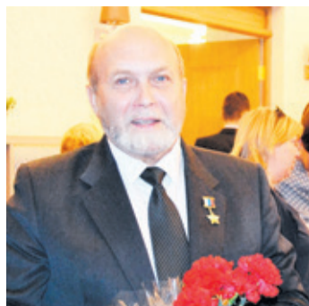
9 декабря – День Героев Отечества