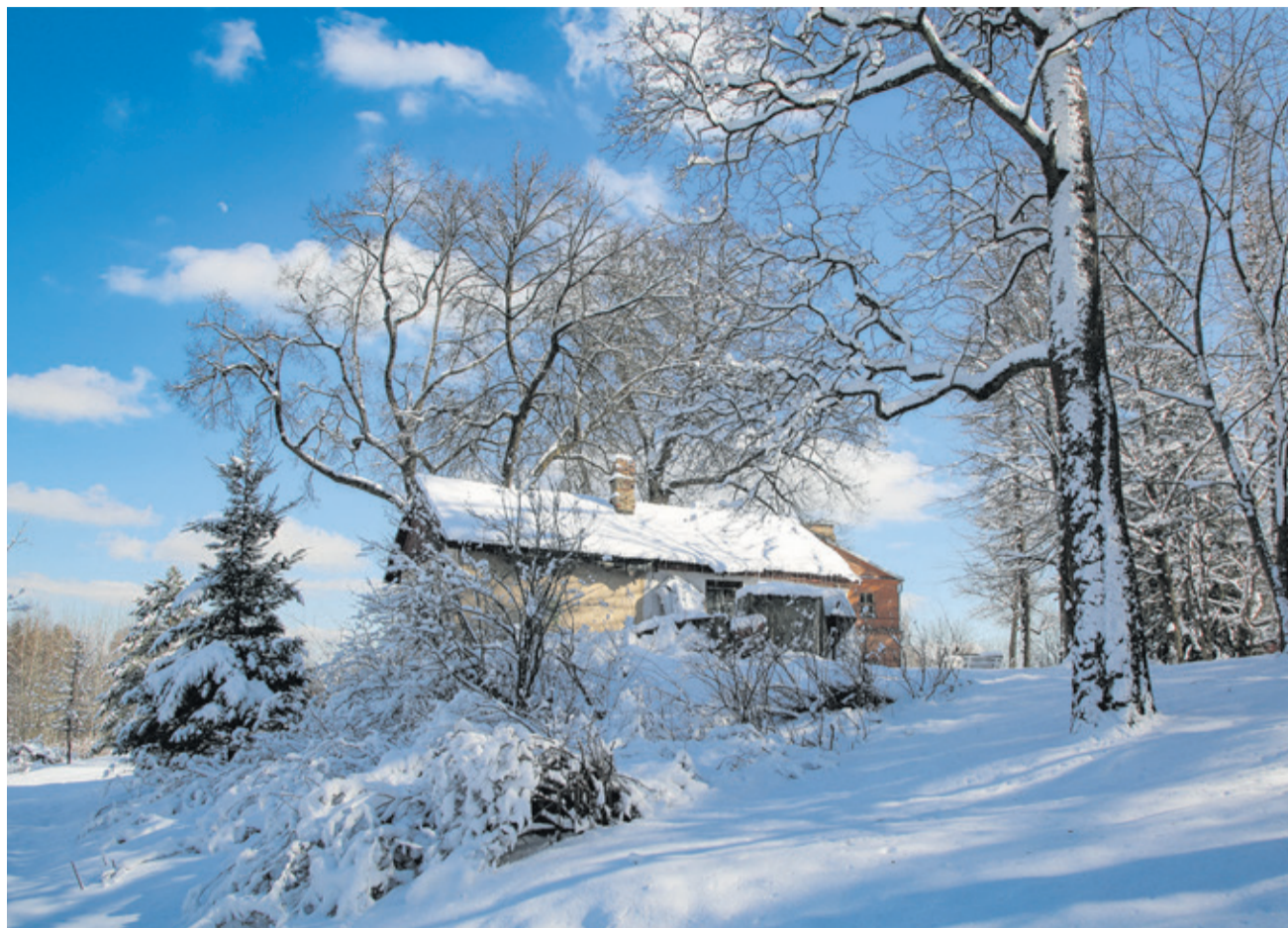
«Мороз и солнце; день чудесный!»