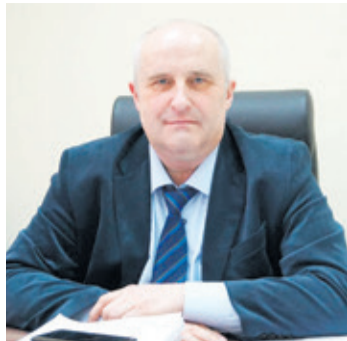
Во Всеволожском районе – новый руководитель