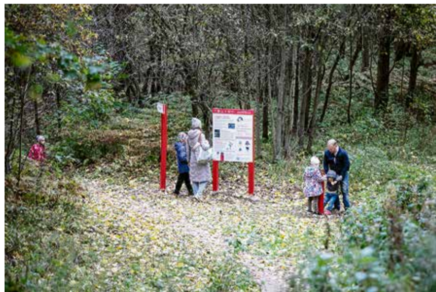
Маршрут стал частью проекта «Тропа47».

Еще одна особенность Курголовской тропы заключается в том, что информационные стенды, установленные вдоль всего маршрута, рас-