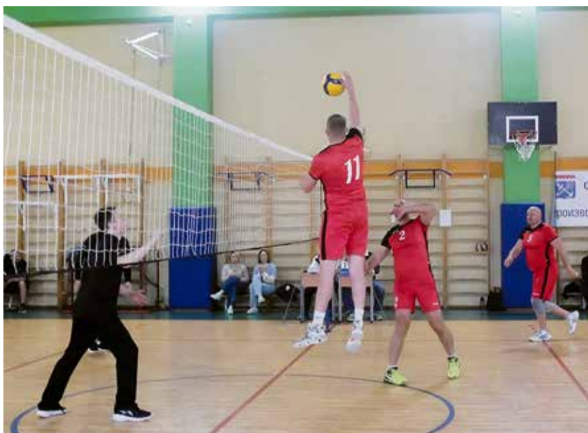
Шестеро мужчин в самом расцвете сил, как на подбор, ростом не ниже 190 см, смотрелись на фоне своих соперников в первом матче просто богатырями.

Команда «Лесколовской жилищной организации», представлявшая Всеволожский район, не оставила шансов своим соперникам в мини-футболе, дартсе и перетягивании каната. Она уступила лишь лидерам в настольном теннисе, плавании и волейболе. Хотя, наблюдая за игрой наших волейболистов, складывалось впечатление, что на площадку вышли