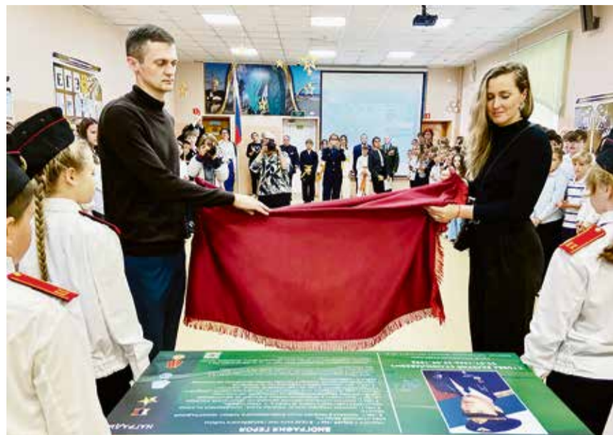
Символично, что именно 29 сентября, в день гибели Валерия Стомбы, в Рахьинской школе была торжественно открыта Парта Героя.

Символично, что именно 29 сентября, в день гибели Валерия Стомбы, в Рахьинской школе была торжественно открыта Парта Героя. На торжественном мероприятии в Ленинском зале школы собрались родные и близкие, сослуживцы Валерия Станиславовича по 20-й авиационной эскадрилье Северо-Западного погра-