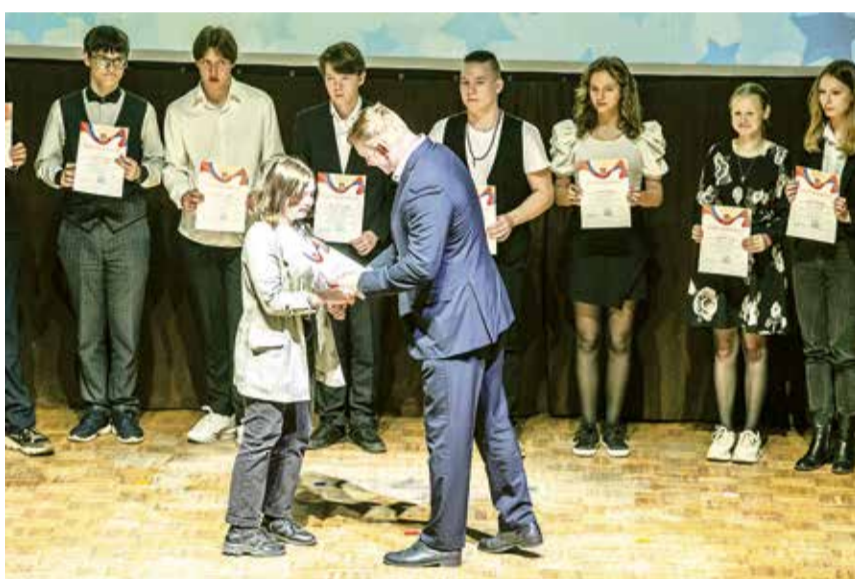
Всего в этом году именные премии Главы администрации получат 479 учащихся из 39 школ.

ных. Он вкладывает в обучение свои силы, энергию и любовь. А Всеволожский район может похвастаться крепким педагогическим составом: за последние годы число умников и умниц растет.