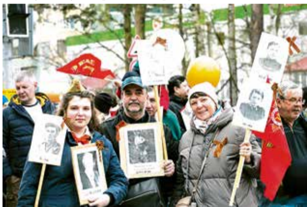
Центральные точки можно будет посмотреть на сайте волонтерыпобеды.рф

Акция предполагает установку стендов, куда любой желающий сможет прикрепить портрет своего Героя, который каждый год проносит во Всенародном шествии «Бессмертный полк», с указанными ФИО, званием и годами жизни. В преддверии Дня Победы «Стены Памяти» будут организованы по всей России и за рубежом: в школах, домах культуры, дворцах спорта, библиотеках, музеях, университетах, предприятиях, банках и т.д.