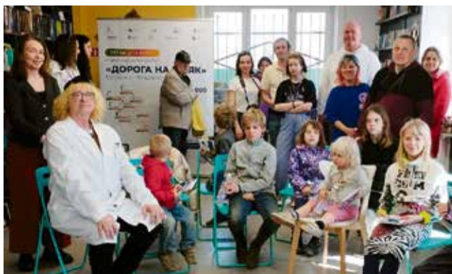
В библиотечной «Точке кипения – Вартемяги» профессор в шуточной форме проверил у детей и родителей «недо книжие», раздал подарки и провел фотосессию.

Главное, что организаторы пробега хотели донести в рамках этой акции – нет в медицине слов «безнадежный», «невозможно». Педиатрический университет обладает уникальными компетенциями по 52 профилям лечения детей в возрасте от 0 до 18 лет, включая высокотехно-