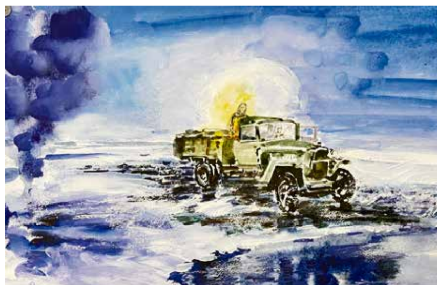
С иконой в руках «Господь Вседержитель» через Ладогу. Художник Яна Дук

Светлана ЗАВАДСКАЯ