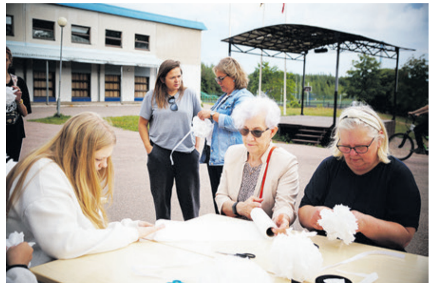
27 июля в Ленинградской области, как и во всей стране, прошла акция «Белые Ангелы» в память о погибших детях Донбасса

27 июля в Ленинградской области, как и во всей стране, прошла акция «Белые Ангелы» в память о погибших детях Донбасса. В 2023 году её символом стали белые бумажные кораблики, птицы и цветы.