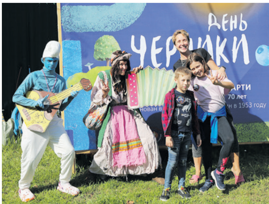
Центром праздничных торжеств стала Поляна – своего рода общественное пространство на территории садоводства «Осельки»

Ежегодно летом в Суздале отмечают День огурца, в Лужском районе – День лука, деревня Озерье прославилась на всю Россию своим Днём горохового стручка. А в ДНТ «Осельки» близ поселка Лесколлово в этом году впервые прошел праздник черники – царицы лесов Ленинградской области. В минувшую субботу там дебютировал красочный фестиваль, в программе которого были забавные конкурсы, модное дефиле, обильное угощение и гарантированное отличное настроение.