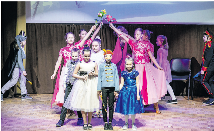
Десятки творческих коллективов в течение двух дней показывали спектакли, декламировали разные произведения. Среди участников и школьные театры, и представители сферы дополнительного образования Всеволожского района.

Оригинальный спектакль «Рождественский вертеп» подготовила театральная студия «Окно» из разметелевской «Точки роста». Они представили на суд жюри историю, описанную в Евангелии от Матфея. Кстати, коллектив недавно провёл Рождественские гастроли по Всеволожскому району, даря незабываемые впечатления от сюжета не только младшему поколению, но и старшему.