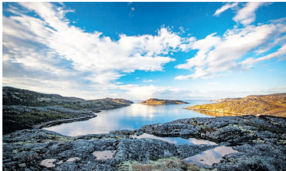
Северная часть Ара-Губы, остров Большой Арский и выход в Мотовский залив