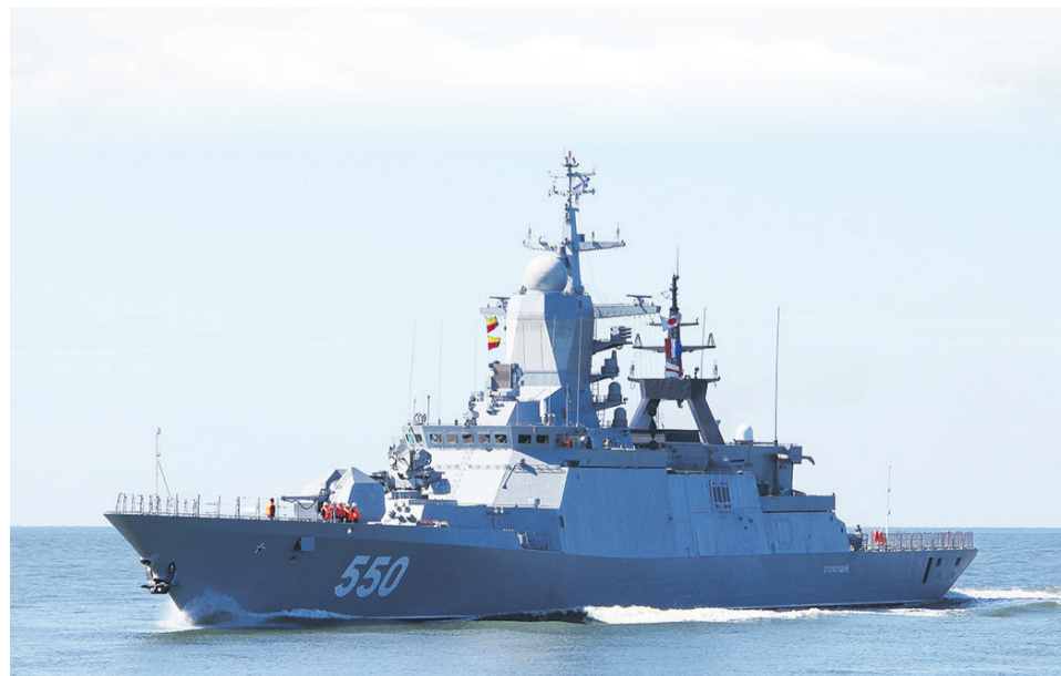
Корвет «Стерегущий» (проект 20380)

■ АВТОР Владимир ШЕМШУЧЕНКО