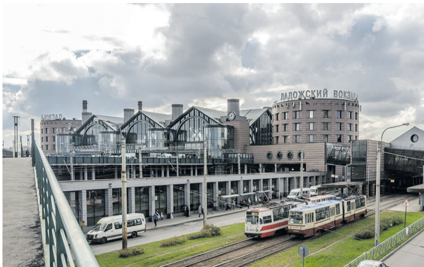
Почти год нам предстоит как-то обходиться без привычных маршрутов, но городские и областные чиновники продумали новую схему движения транспорта

В субботу, 4 марта, на плановый капитальный ремонт закрывается станция метро «Ладожская» – одна из самых загруженных в цепи Правобережной линии системы Санкт-Петербургского метрополитена. Сейчас на «Ладожскую» в среднем входят 44 тысячи человек в день, а в пиковый утренний час она принимает 8,7 тысячи пассажиров. Для сравнения, «Площадь Александра Невского-1» обслуживает 24 тысячи человек в день, «Площадь Александра Невского-2» – 10,6 тысячи, «Новочеркасская» – 28 тысяч. Пиковые нагрузки на них не превышают 4,6 тысячи человек в час.