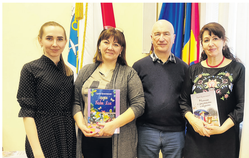
Из-под пера Сергея Булыгинского вышли уже полюбившиеся детям произведения: «Сказки Бабы-Яги», «Хозяин Вечного Леса», «Снежные сказки», «Мишка с разными глазами»

Он также коротко рассказал о себе, а затем с большим успехом читал свои стихи, сказки и загадывал загадки. Гости библиотеки узнали