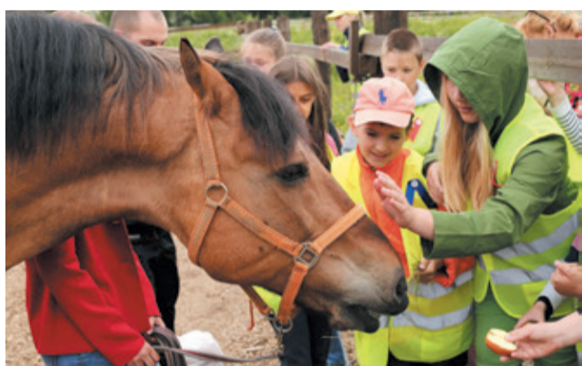
Калгановский конный завод готовит семейные экскурсии для ленинградцев

Авторами новаторской программы стали преподаватели кафедры социально-культурного сервиса и туризма ЛГУ им. А.С. Пушкина. Перед учёными стояла амбициозная задача: передать ключевые компетенции в относительно короткие сроки. Результатом их работы стали 6 тема-