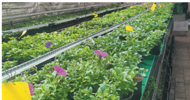
Оранжерея в Колтушах ждёт гостей