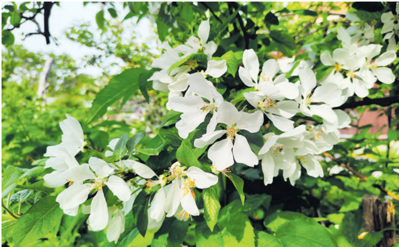
«И краски поздней, яблочной весны...»