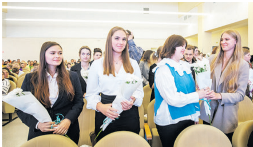
Грамоты получили педагоги, показавшие высокие результаты в прошлом учебном году, а также победители конкурсных программ различного уровня