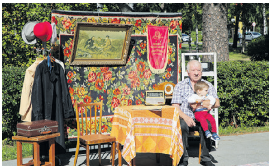
В парке возле Центра культуры и досуга работала ретроплощадка «В ритме города»

ствовала выстроившаяся к ней длинная очередь – все хотели запечатлеть счастливые моменты в осязаемом, так сказать, формате, тем более что услуга эта была совершенно бесплатной. Неожиданный и немалый интерес вызвал установленный фандомат – аппарат для сбора алюминиевых банок и пластиковых бутылок, где за сданную «тару» выдаются так называемые экобаллы, которые можно потратить на продукты или получить, например, скидку на покупку книг. Полезная инициатива получила одобрение!