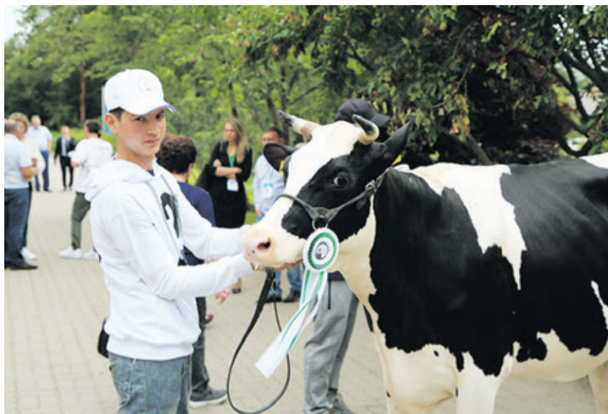
Сегодня Ленинградская область занимает лидирующие позиции по развитию племенного животноводства.