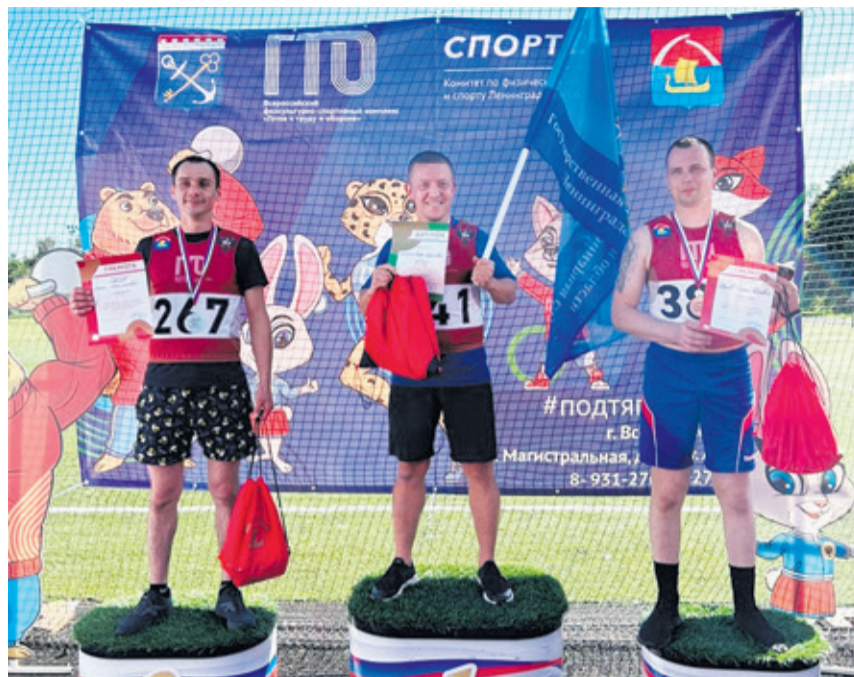
Спортсменам-любителям предстояло пройти испытания 9 – 12 ступеней Всероссийского комплекса ГТО