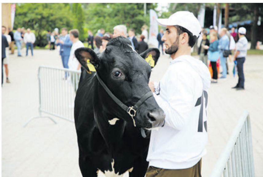
На «Белые ночи» приехали представители не только из разных областей России, но и гости из Белоруссии.

– Изумительные стада и высокая продуктивность позволяет 47-му региону занимать лидирующие позиции в этой отрасли, – подчеркивает специалист. – Знаете, недавно один известный зарубежный эксперт поделился мнением, что российские коровы ничем не отличаются от высокоудойных «иностранок». Это отличная оценка.