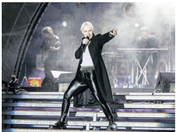
Гвоздем программы стало яркое выступление хедлайнера российской эстрады Ярослава Дронова, выступающего под псевдонимом SHAMAN