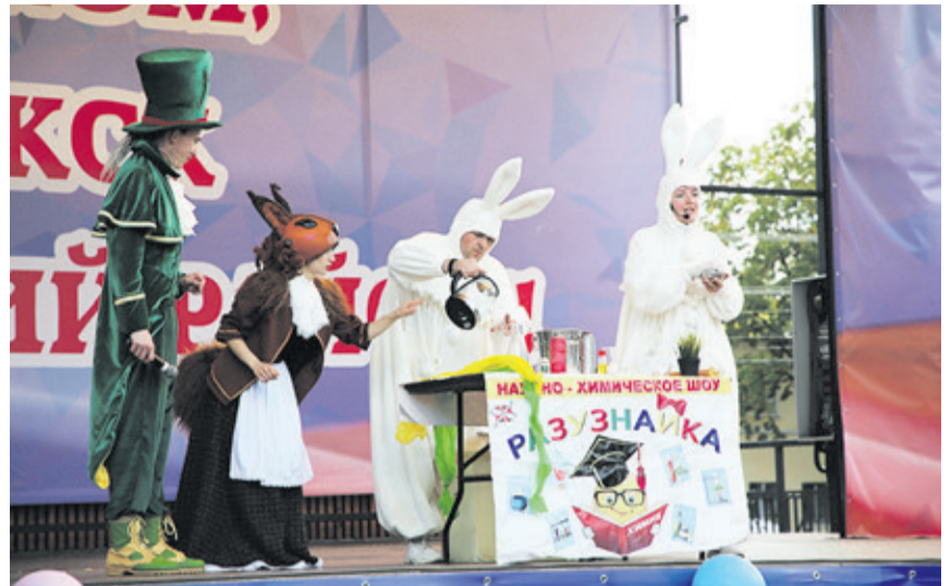
В полдень на Юбилейной площади широко распахнул двери фестиваль интерактивных развлечений «Город детства»

Огромной популярностью пользовалась фотобудка, о чем свидетель-