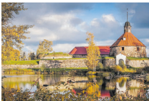
Крепость Корела (Приозерский район)