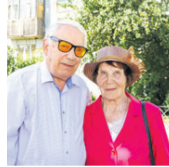
«Золотая семья» живёт в Янино