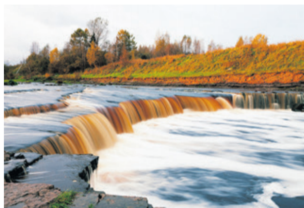
Саблинский водопад (Тосненский район)