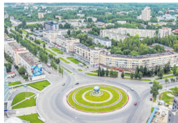
Панорама города Кириши (Киришский район)