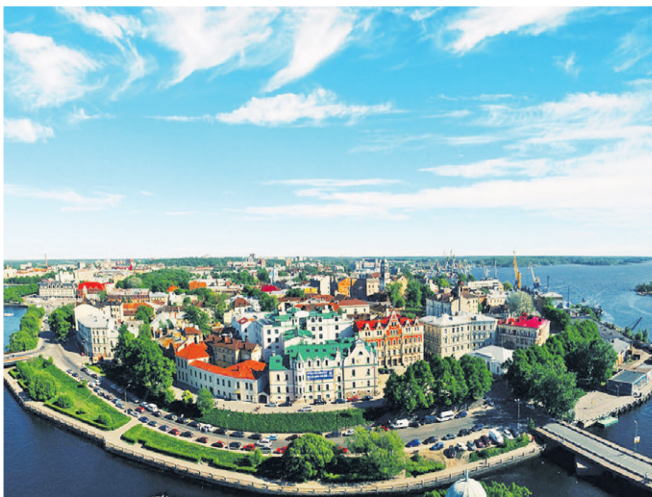
Панорама Выборга (Выборгский район)