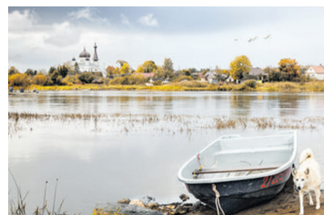
Деревня Скамья (Сланцевский район)