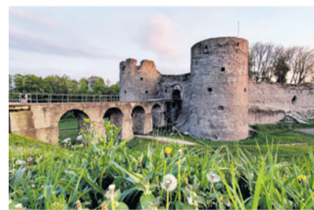
Крепость Копорье (Ломоносовский район)