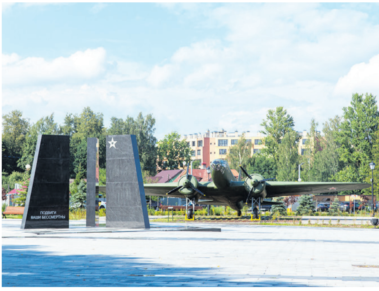
Парк 75-летия Победы (Всеволожский район)