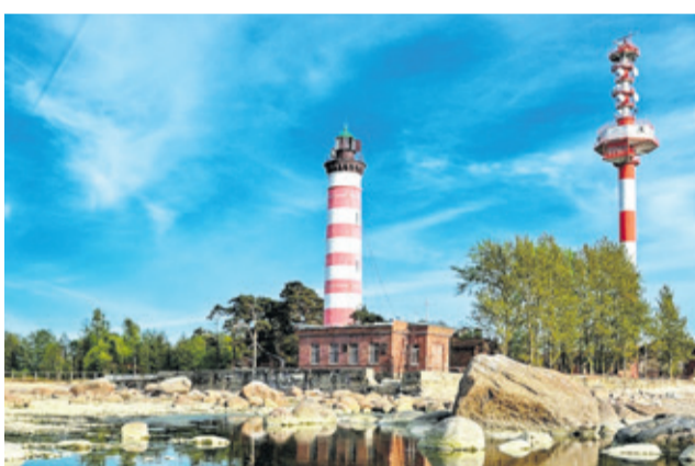
Шепелевский маяк (Сосновый Бор)