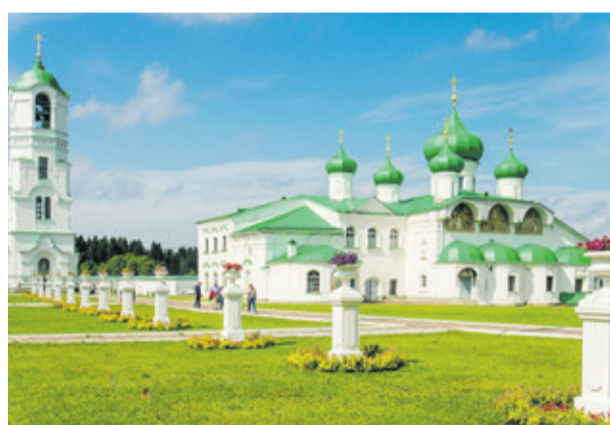
Алекسانдро-Свирский монастырь (Лодейнопольский район)