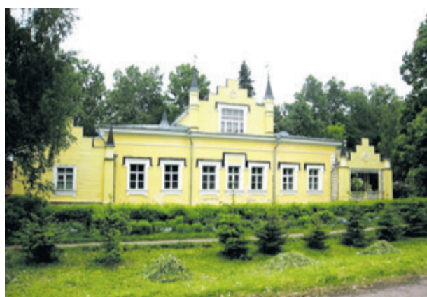
Музей-усадьба Н.К. Рериха в Изваре (Волосовский район)