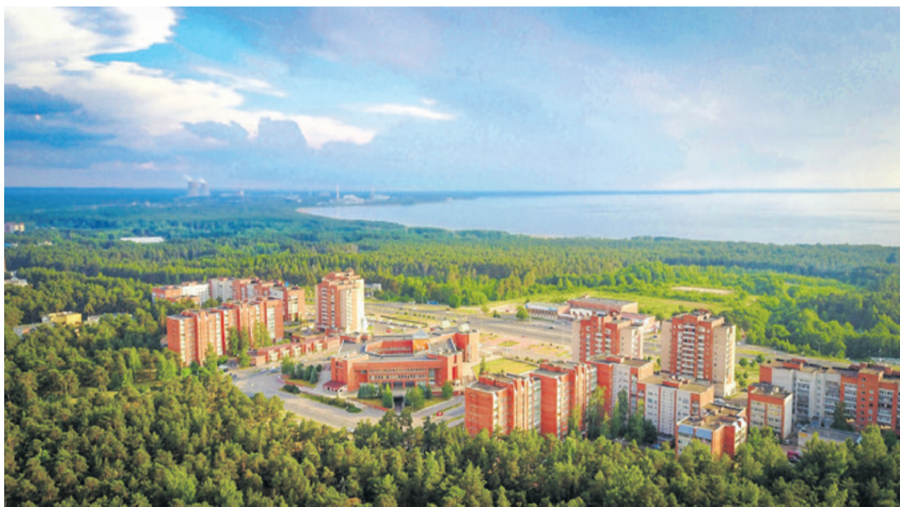
Сосновый Бор – столица празднования Дня Ленинградской области