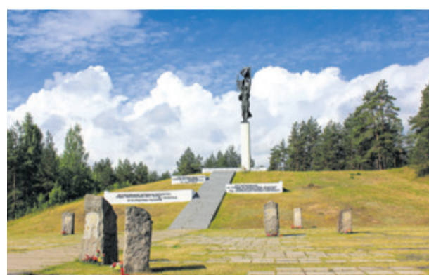
Мемориал партизанской славы (Лужский район)