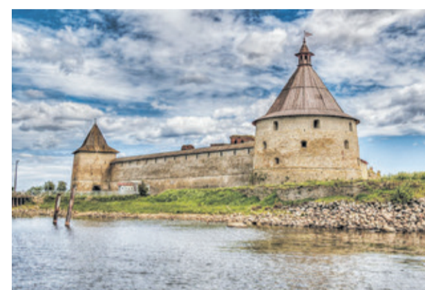
Крепость Орешек (Кировский район)