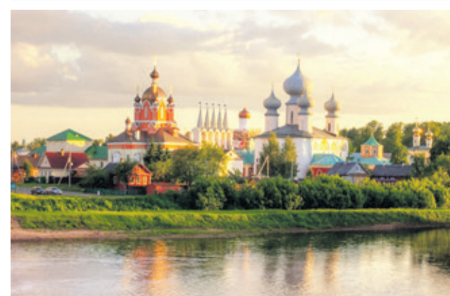
Тихвинский монастырь (Тихвинский район)