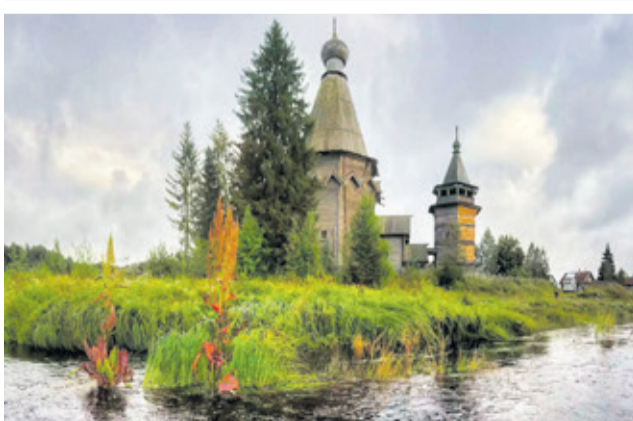
Согиницы (Подпорожский район)