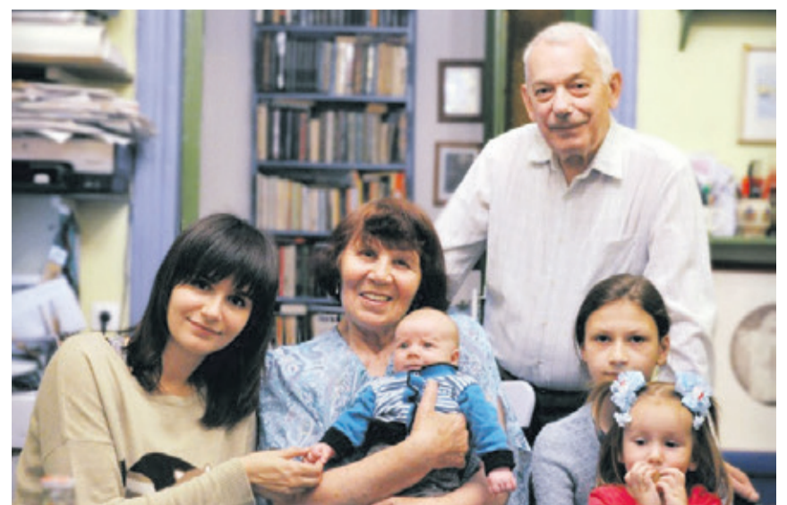
Супруги Голушковы с внуками