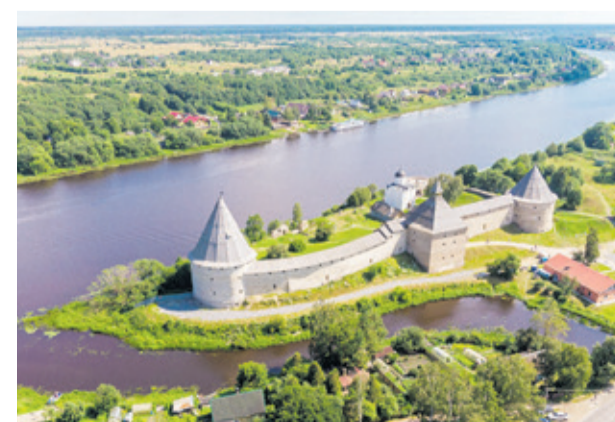
Старая Ладога (Волховский район)