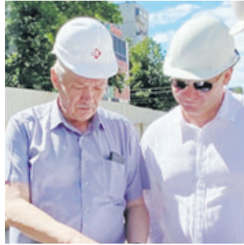
Главы о Всеволожске