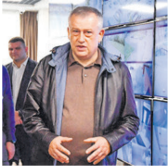
Губернатор ЛО на строящихся объектах региона