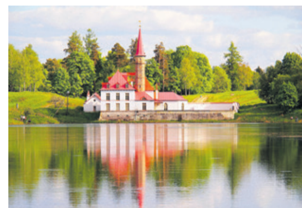
Приоратский дворец (Гатчинский район)