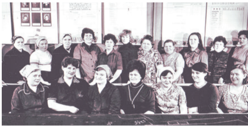
– Фабрика была основана в середине 40-х годов прошлого века. Все начиналось с цеха по пошиву и ремонту солдатского обмундирования.

С годами предприятие открывало новые оснащенные цеха-филиалы. После распада СССР печальная участь советских предприятий нас миновала. Руководство пересмотрело планы и заложило первый кирпичик в фундамент новой эпохи развития. Благодаря слиянию двух предприятий – «Фабрика