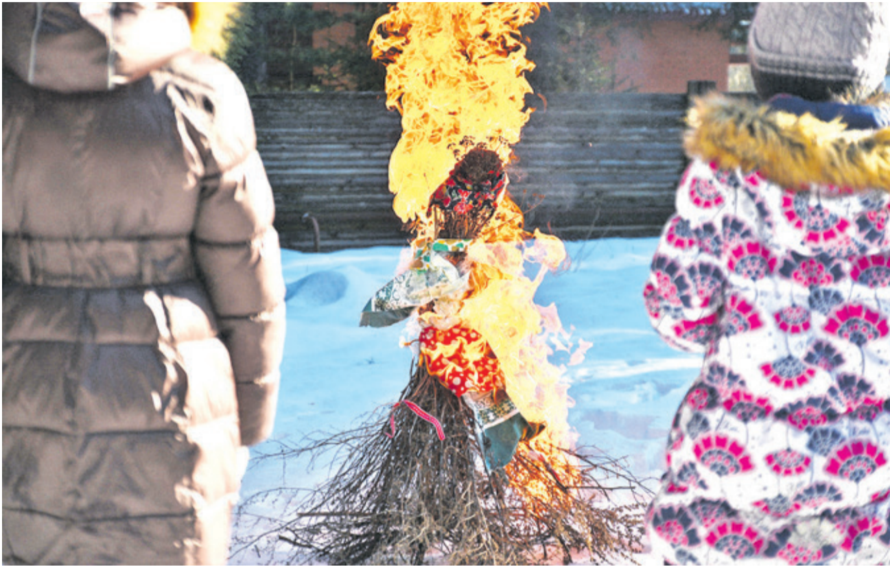
Прощание с зимой