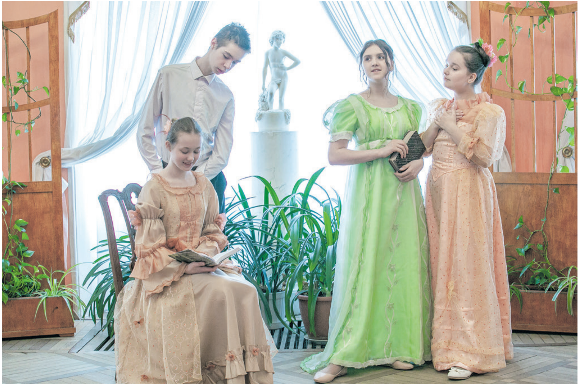
«Теперь с каким она вниманием читает сладостный роман...». Сцена из театральной постановки Образцового детского коллектива «Люди и куклы» (ДДЮТ) в Музее-усадьбе «Приютино».