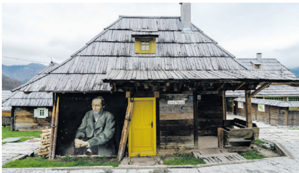
В деревне Дрвенград

Подготовила Татьяна ТРУБАЧЕВА