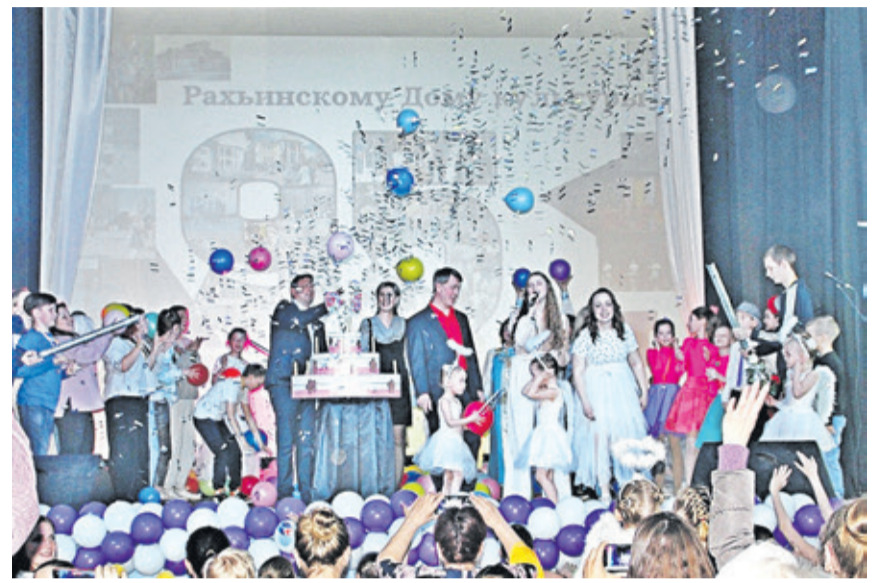
Праздничный вечер по случаю юбилея Рахьинского ДК прошёл весело и ярко

В 2014 году Дом культуры был включен в региональную программу капитального ремонта, рассчитанную на три года. За это время внешний вид