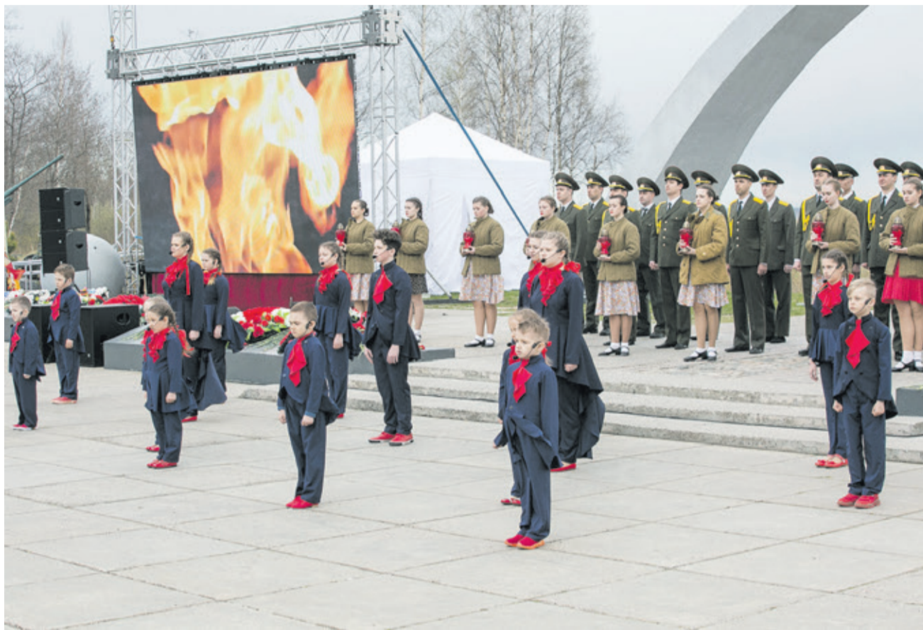
После экскурсии все участники торжественной церемонии вновь перешли к мемориалу «Разорванное кольцо»