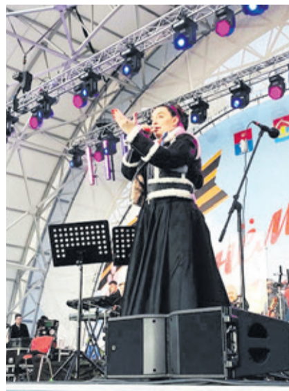
Специальным гостем праздника стала певица Елена Ваенга

■ АВТОР Ирэн ОВСЕПЯН