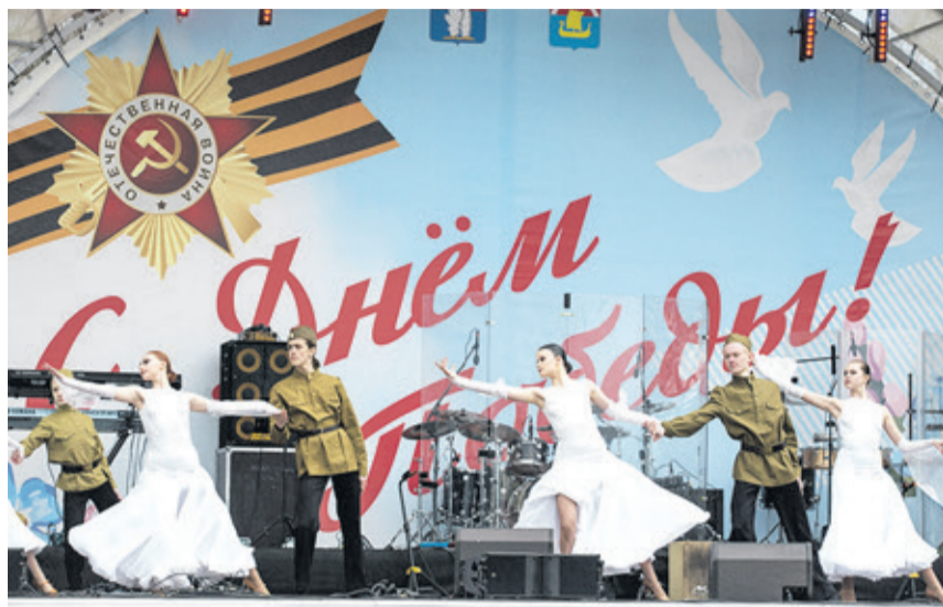
Музыкальным подарком для жителей и гостей Всеволожска стали выступления творческих коллективов района, которые друг за другом выходили на сцену