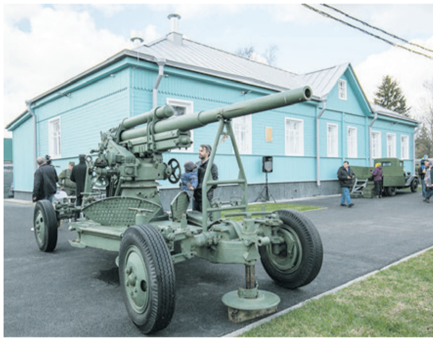
Музей занимает подлинное историческое здание