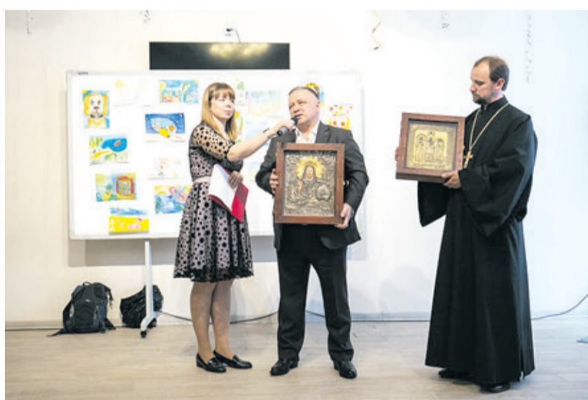
Члены попечительского совета гимназии подарили учебному заведению отреставрированные иконы