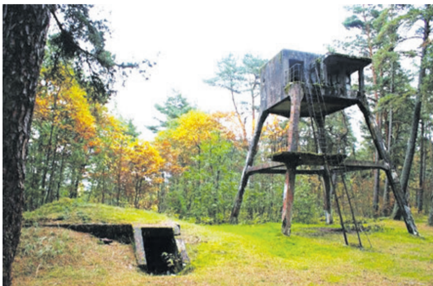
Заброшенный наблюдательный пункт береговой батареи