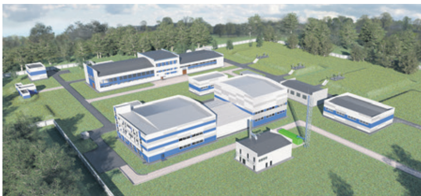
ВОС Всеволожск. Эскиз из проекта

Также в 2020 году была разработана проектная документация на реконструкцию водоочистных сооружений города Всеволожска, получившая положительное заключение негосударственной экспертизы. В настоящее время проводятся необходимые и окончательные согласования такой проектной документации в целях начала осуществления работ по реконструкции водоочистных сооружений. Первый этап – реконструкцию водоочистных сооружений производительною до 31,5 тыс. куб.м в сутки – планируется начать в текущем году.