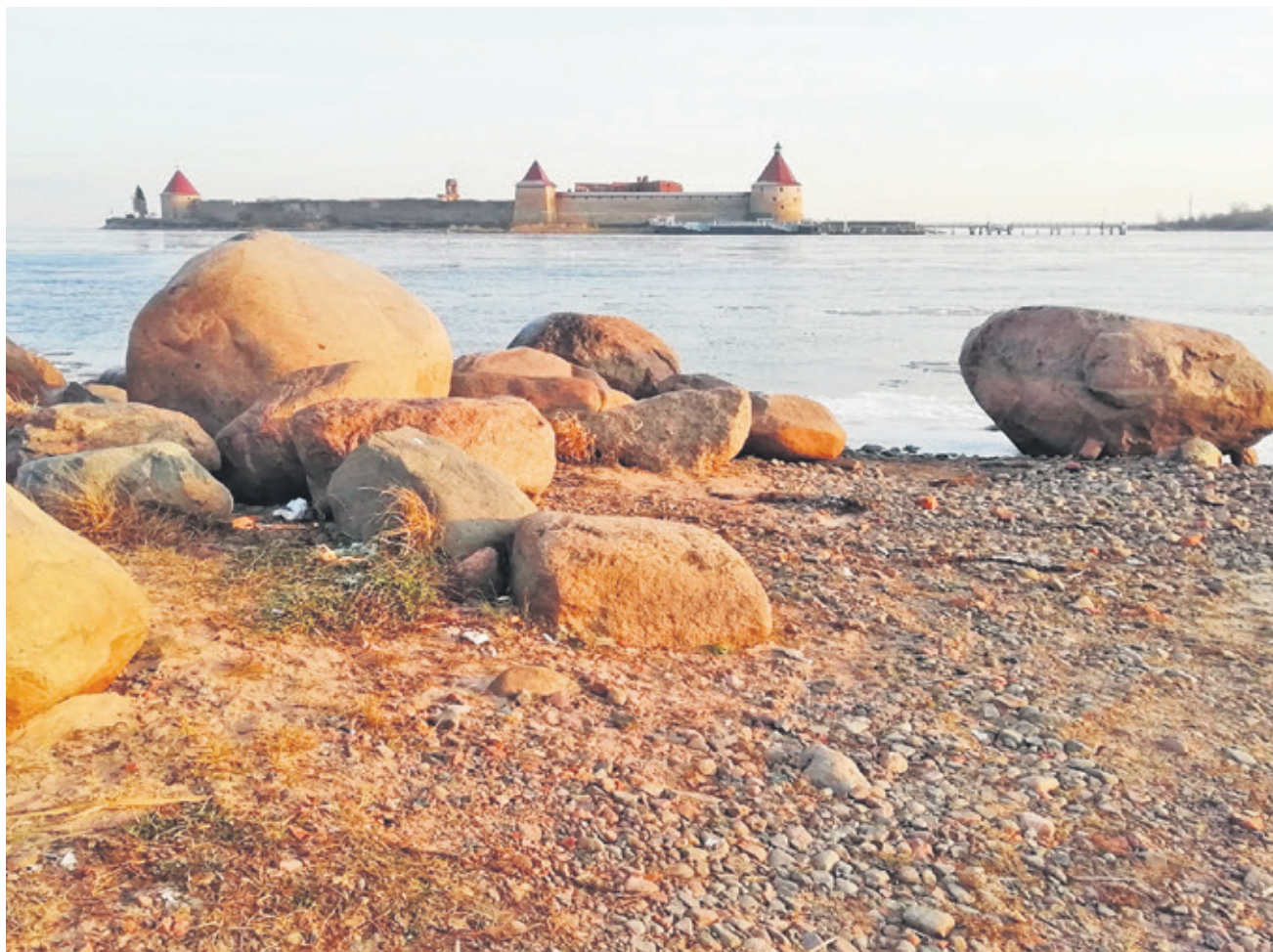
В 2019–2020 году этот кадр вышел в полуфинал фотоконкурса «Самая красивая страна», который проводится под эгидой Русского географического общества.