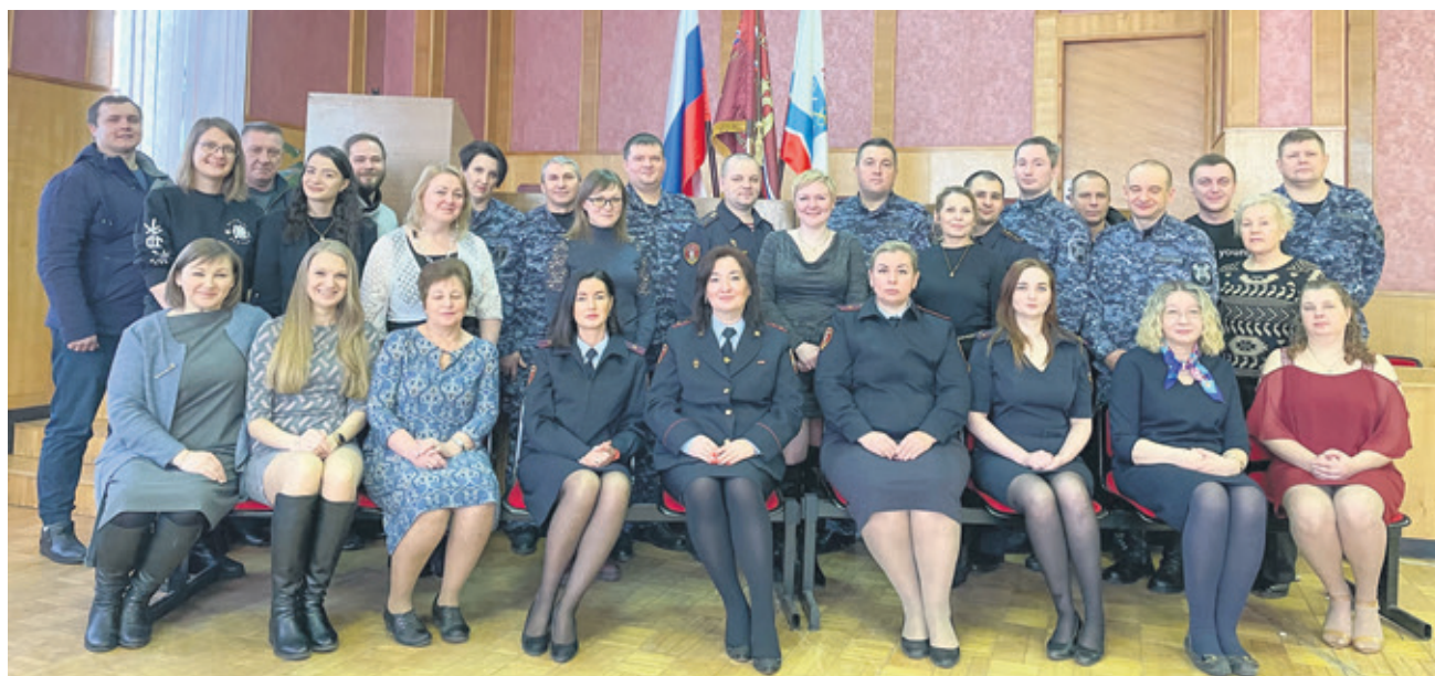
Коллектив отдела вневедомственной охраны