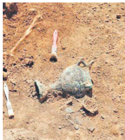
Находка Максима в земле и на выставке

– Я смотрю: в центре зала под стеклом стоит котёл, очень похожий на тот, который мы нашли, будучи студентами. Ну – прямо капля в каплю. Подошёл поближе, читаю: «Котёл найден в 2016 году во время экспедиции под руковод-