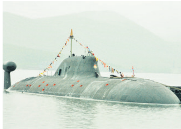
Современная АПЛ «Щука»

Последняя «Щука» этого проекта была достроена в самом начале 90-х, но им на смену уже пришла новая хищница – пр. 971 «Щука-Б». Она стала первой массовой лодкой третьего поколения и стальным двойником титановой горьковской «Барракуды». От своей предшественницы она унаследовала скрытность и боевую мощь, став ещё тише и боеспособнее. На сегодня «Щука-Б», или, по наговской кодировке, «Акула», – основная многоцелевая лодка российского ВМФ.