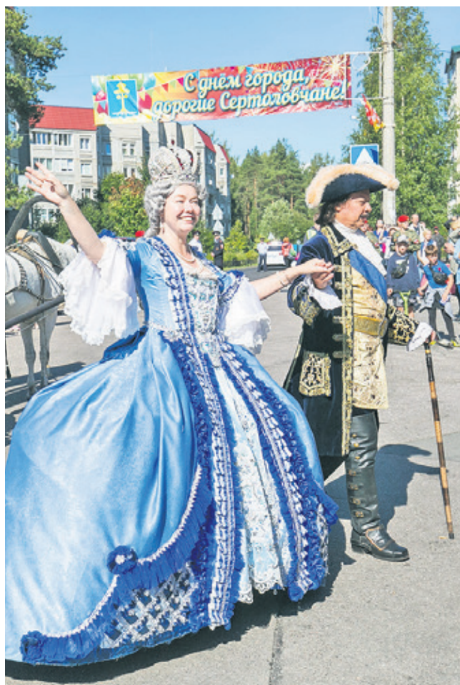
Сердоловчане отмечают День города

– Безусловно. У нас есть абсолютное взаимопонимание с советом депутатов, в котором собрались компетентные, грамотные люди, а главное – болеющие душой за нашу сердоловскую землю. Все они – местные жители, не понаслышке знающие о насущных проблемах поселения, а главное – готовые принимать адекватные решения. В их числе – руководители образовательных учреждений, предприятий, общественных и ветеранских организаций, представители бизнес-сообщества. То есть люди, которые могут не только обозначить проблему, но и способствовать её решению, используя в том числе собственные ресурсы и возможности. Я как глава администрации очень ценю такое единение двух ветвей муниципальной власти.