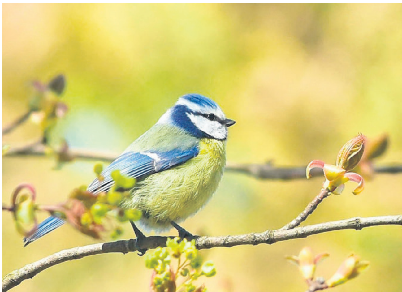
«Песни весенней намёк»