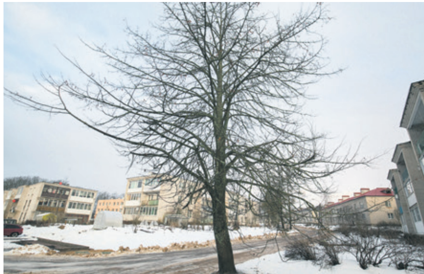
На деревенской улице

Сегодняшний наш рассказ в рубрике, которую мы открыли в этом году, – о деревне, входящей в состав Токсовского городского поселения: очередная наша точка на карте района – старинная деревня Рапполово.