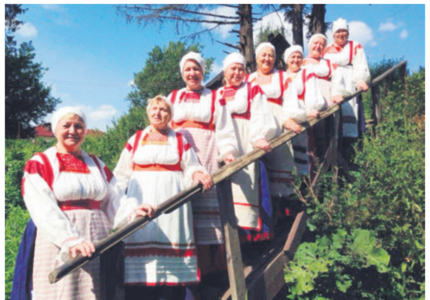
Фольклорно-этнографический ансамбль «Рейнтошки»

Сейчас здесь работает не только библиотека, но и два года назад активно включился в жизнь деревни Культурно-досуговый центр. Этот центр, как это сейчас принято говорить, – межпоселенческий. В подчинении Токсовского МО,