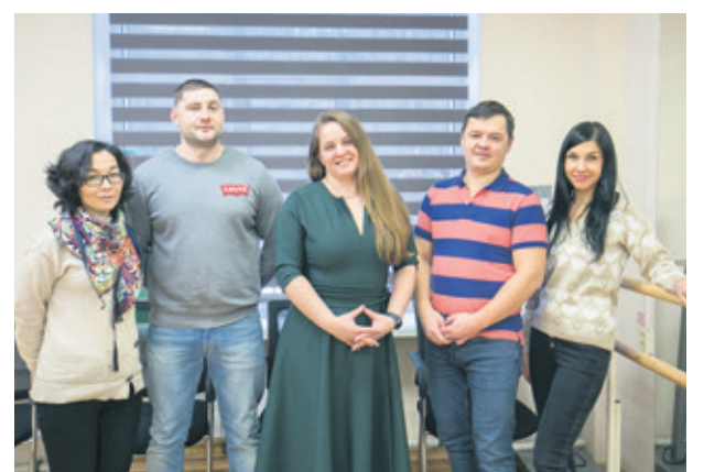
Актив Культурно-досугового центра