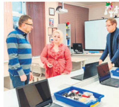
В школе № 4

средства приобрел свето-, видео- и звуковую аппаратуру. Учреждения спорта использовали 160 тыс. руб. Всеволожский агропромышленный техникум на полмиллиона рублей приобрел в учебные классы 15 компьютеров, а Всеволожская КМБ на 770 тыс. руб. оснастила приемное отделение современными каталками для транспортировки тяжелых больных. Всего 16 бюджетных организаций г. Всеволожска за прошедший год улучшили свое материально-техническое оснащение за счет депутатского фонда. Использование средств строго регламентировано и проверяется счетной палатой.