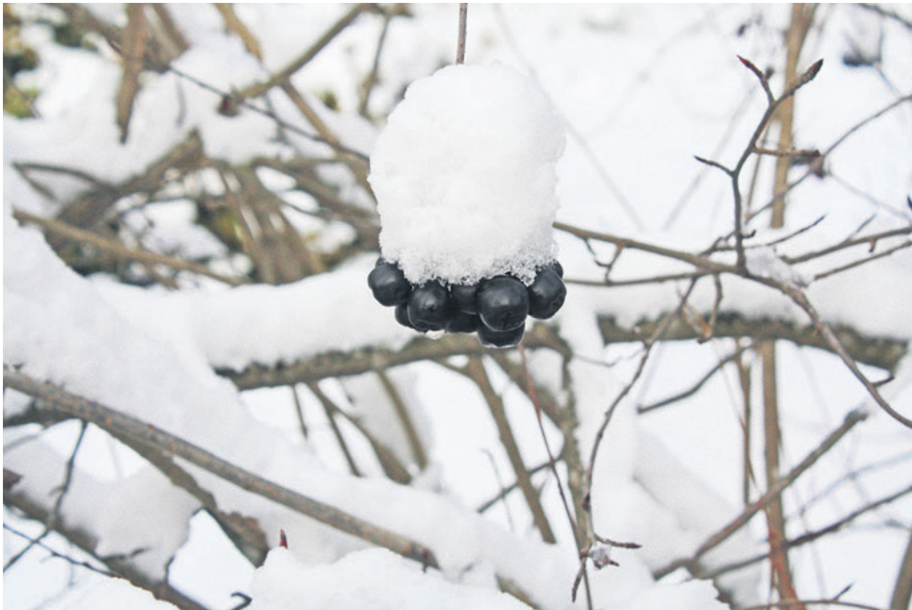
И всё-таки он выпал!