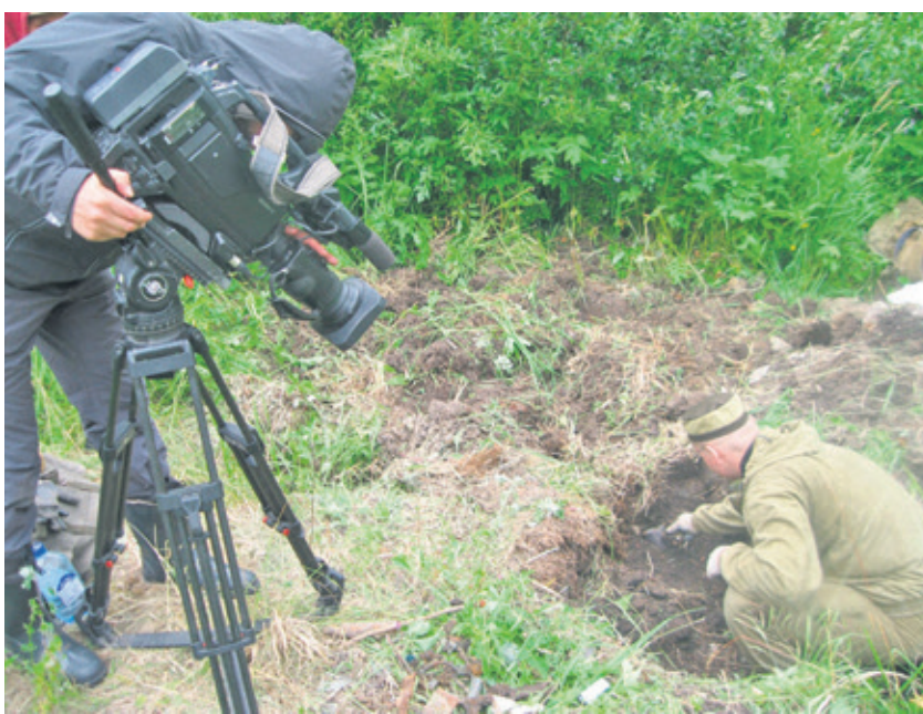
На станции Погостье во время съёмок фильма «Поколение, уходящее в вечность».