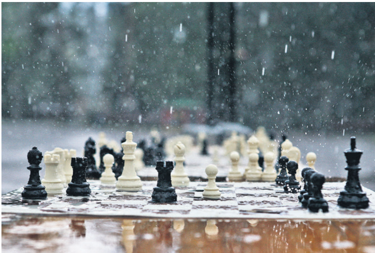
Игра состоится в любую погоду