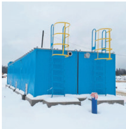
Блочная установка очистки дождевых вод

Ресурсосберегающая мера, которая применяется при возведении логистического центра, – это многократное использование строительных материалов. К примеру, бетонные плиты, необходимые для создания временного дорожного покрытия, используются несколько раз. При завершении строительства на одном участке плиты перемещают на следующий, где начинается активное движение строительной техники.