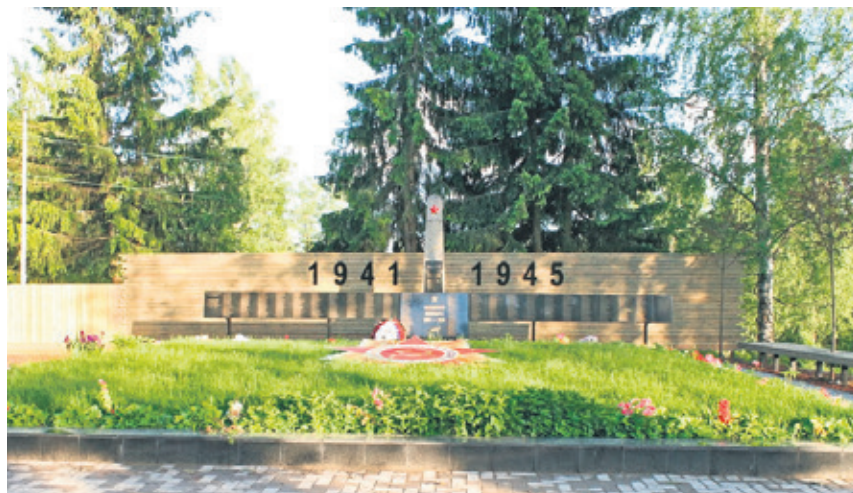
Мемориал в Вартемягах

Поисковики стали прочёсывать все полянки вокруг могилы рапполовского «Ромео». Можно было прекратить