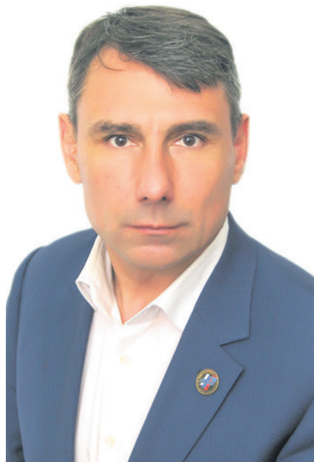
Агитационный материал на должность губернатора Ленинградской области А.Ф. Габитова опубликован бесплатно

Ленинградская область настоятельно ищет сотрудничества между обоими субъектами, предлагает свои варианты. Главный из которых – создание единого оператора. Это будет значительный шаг к интеграции и поможет сохранить экологию для жителей и города, и области.