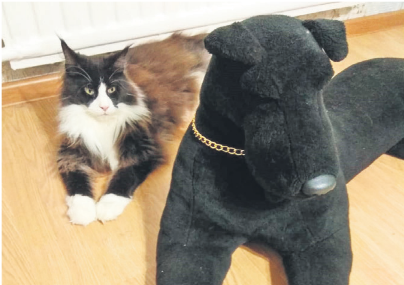
Большой брат следит за тобой...