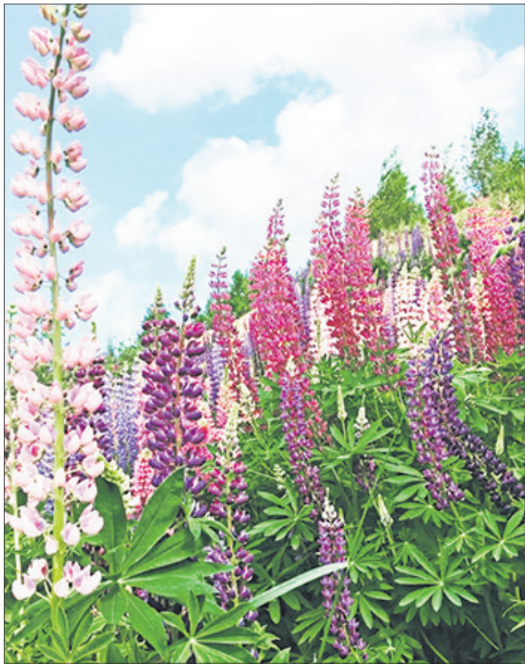
Под простыней сиреновой люпина