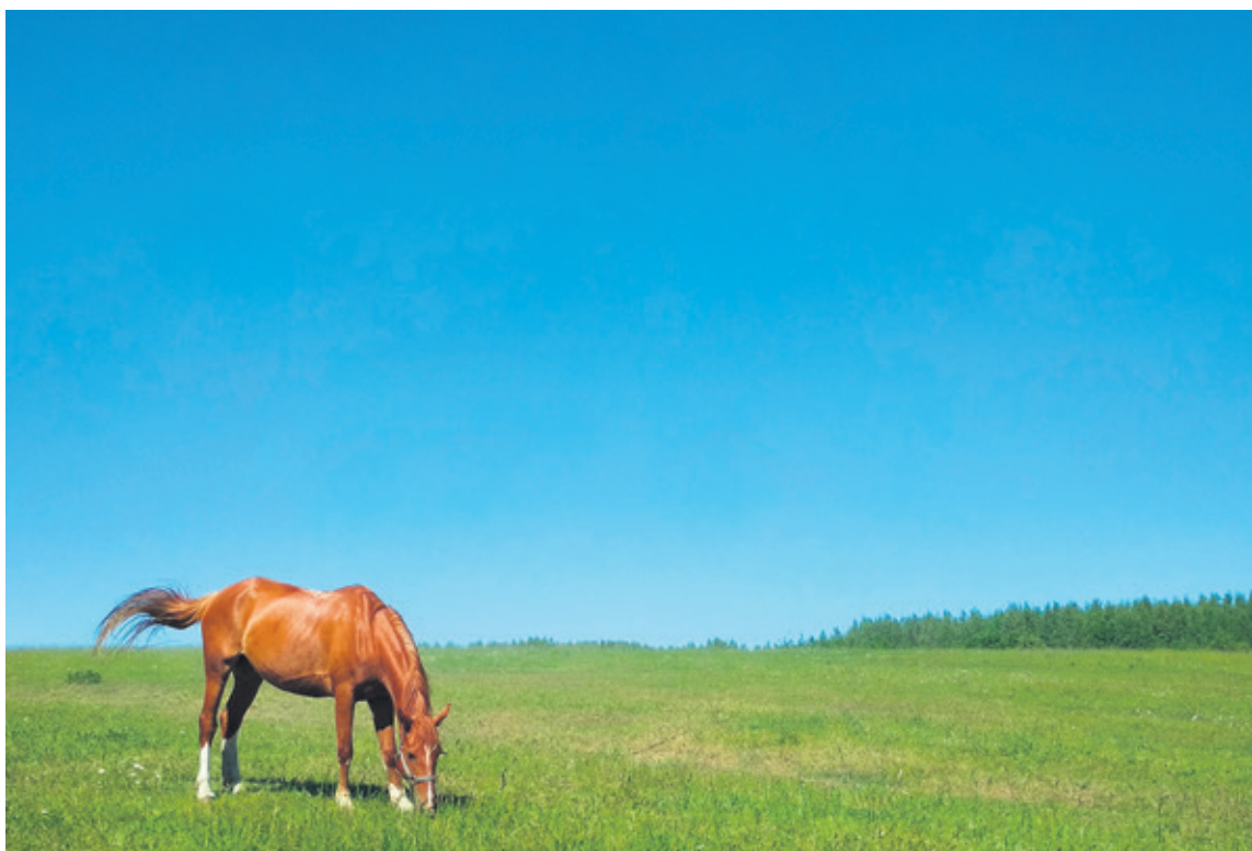
На Румболовском поле