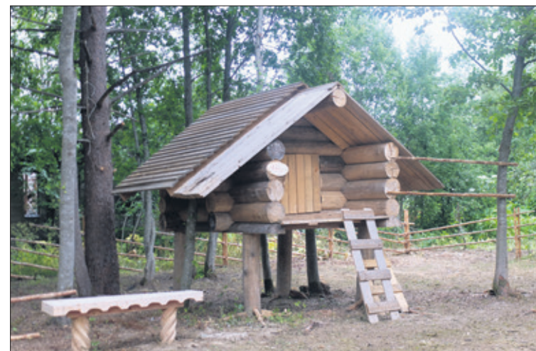
На охотничьей заимке

Деревню Кондуши Янегского сельского поселения трудно найти на карте – она условная. Кондуши объединили несколько старинных деревень с разными названиями. А сейчас это место стало знаменитым, потому что здесь, в окружении густого леса, запланировано создать Центр карело-вепской культуры. Во время пресс-тура мы посетили уже работающий Кондушский Центр карельской культуры: очень уютный. Нас встретили девушки в национальных костюмах, угостили знаменитыми карельскими пирогами – калитками. Они рассказывали местные легенды и говорили на карельском языке. У