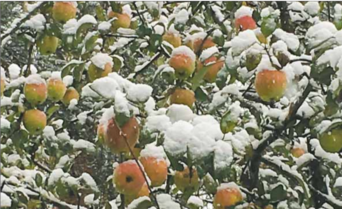
Яблони в снегу

Приглашаем наших читателей принять участие в фотоконкурсе «Остановись, мгновение», который предлагаем посвятить природе, необычным явлениям и фактам. Присылайте свои фотографии по адресу: vsevesti@mail.ru с пометкой «Фотоконкурс». В письме не забудьте указать свои фамилию и имя. Размер фотографии не должен превышать 5 Мб, разрешение – не менее 1 200 пикселей по