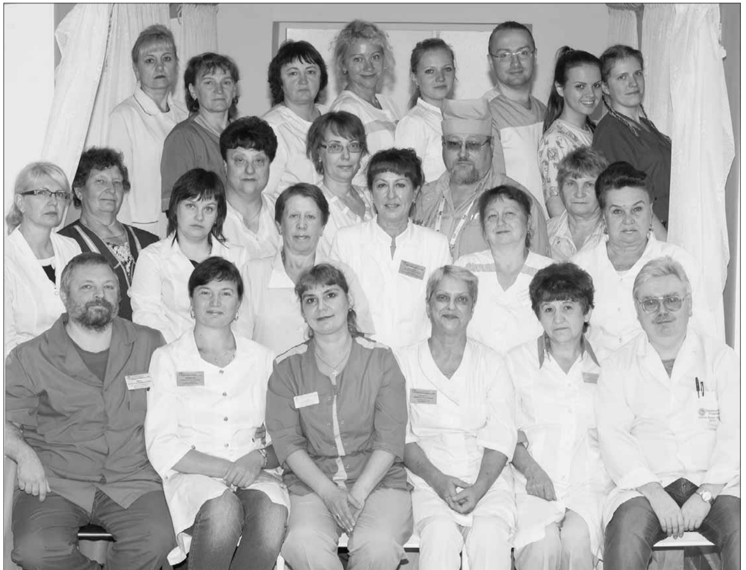
Коллектив первичного сосудистого отделения кардиологии

Ежегодно в отделении проходят обследование и лечение более 1500 человек, осуществляется более 2,5 тысячи консультаций по телефону сотрудникам скорой медицинской помощи. Здесь проводят все необходимые исследования для терапевтической кардиологии по общепринятым европейским стандартам, имеется возможность проведения ЭКГ-исследований. Основной профиль больных, получающих обследование и лечение в отделении, – это больные с острым коронарным синдромом, различными неотложными состояниями, нарушениями сердечного ритма и проводимости, с острым