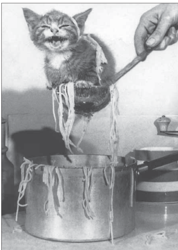
Если вдруг, уж извините, поскользнётесь на кошке, – не тяните эти нити, а тяните нити те!

Расслабляясь и не на двоих, Можно обойтись без вин игристых: Не стесняйтесь комплексов своих, Если это комплексы С-300.