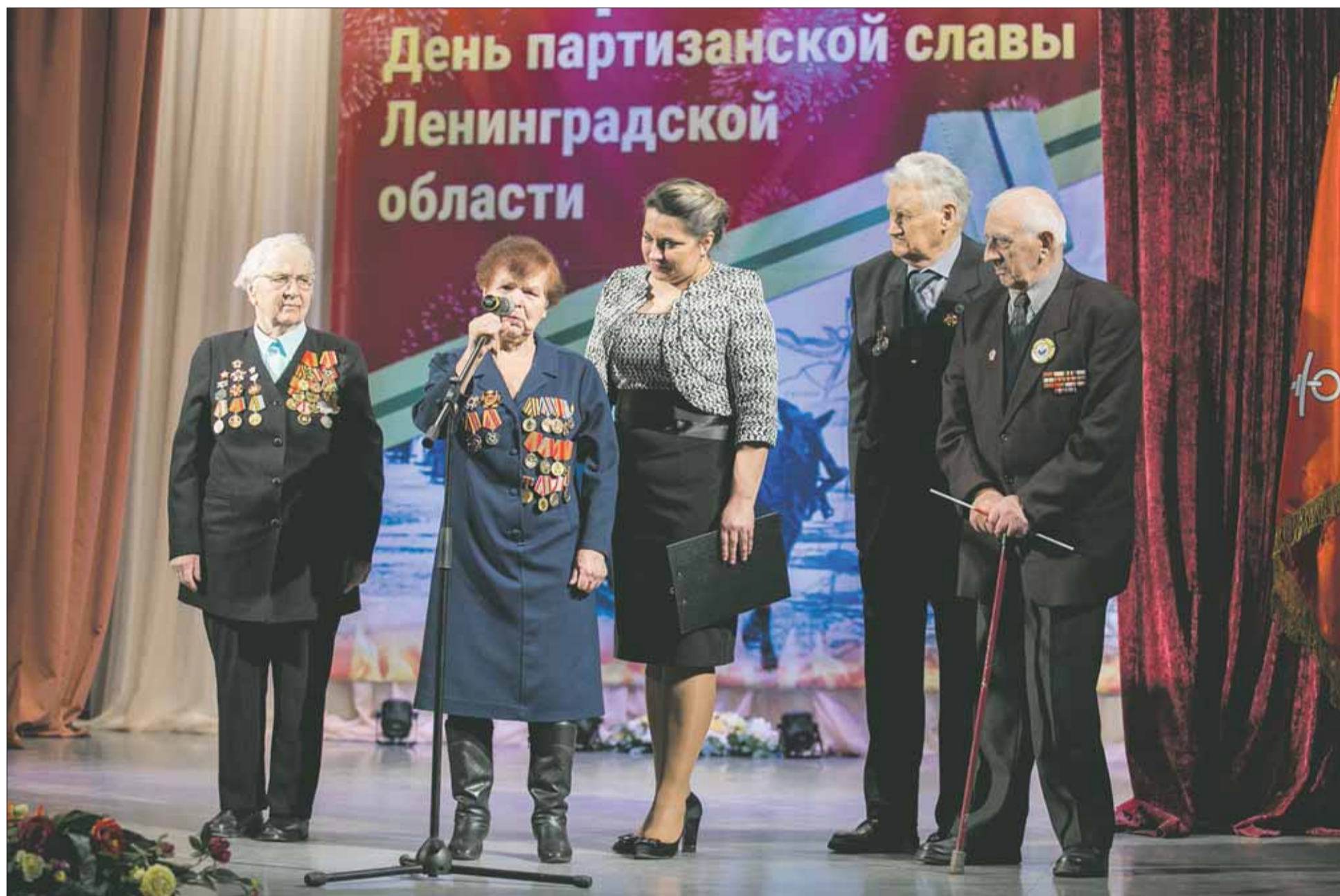
29 марта этого года «День партизанской славы Ленинградской области» отмечался во Всеволожском Доме культуры. К нам приехала делегация из деревни Белебёлка Новгородской области и из посёлка городского типа Дедовичи Псковской области. С приветственными речами выступали представители правительства Ленинградской области и бывшие партизаны. Говорили о том, что в таком важном событии – празднике дружбы и взаимопомощи – должны на равных участвовать три региона: Псковская, Ленинградская и Новгородская области. Материал читайте в следующем номере.