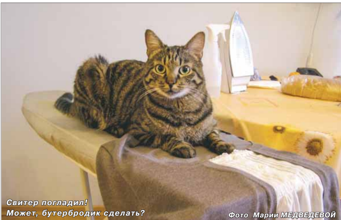
Свитер погладил! Может, бутербродик сделать?