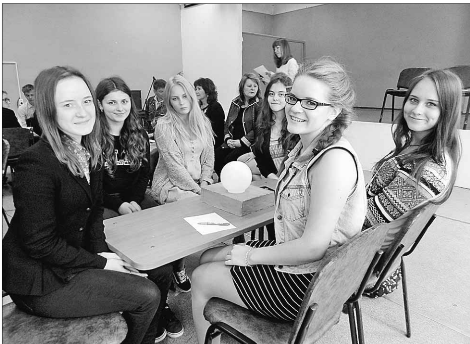
Во время интеллектуальной игры ЗОЖ-ринг