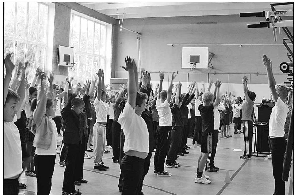
Физзарядка в Лицее № 1

В рамках «Недели здоровья» во Всеволожске, в микрорайоне Южный, состоялся IV районный молодёжный фестиваль «Здоровый образ жизни». На фестивале проходили разнообразные фестивали и конкурсы: спортивно-прикладная эстафета, соревнования по дартсу, флорболу, стритболу, волейболу. Фестиваль продолжался в течение пяти часов. Были устроены всякие развлечения, например, игра «Лопни шар», дети могли попробовать на себе модный аквагим. Было много положи-