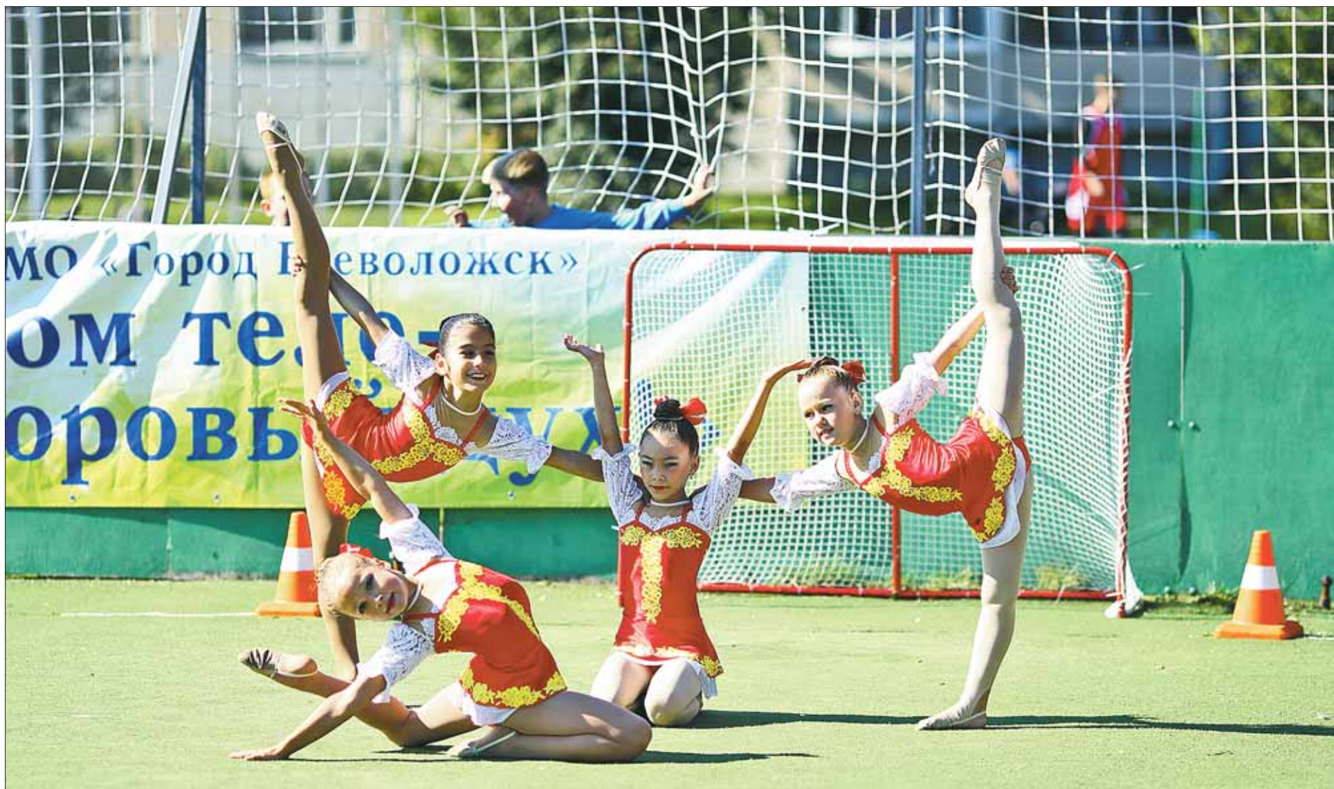
По всей Ленинградской области была проведена акция «Неделя здоровья». О том, как она прошла во Всеволожском районе, рассказывается в материале на 5-й странице.