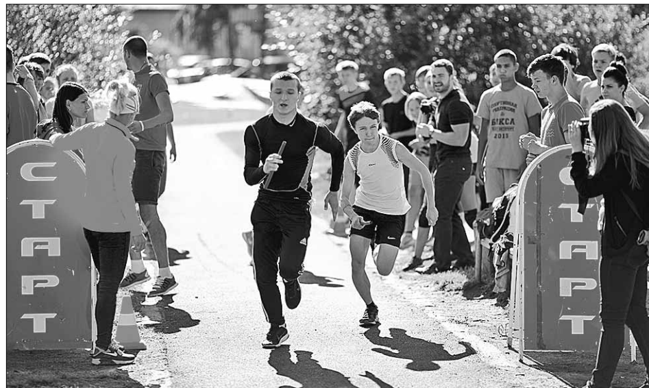
На Всеволожском районном фестивале